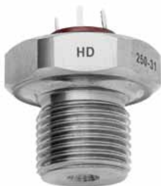
Рис. 3. Микроэлектронные тензопреобразователи избыточного давления HD

Во вторую серию HD (рис. 3) входят микроэлектронные тензопреобразователи избыточного давления, в которых используется технология монолитного цельноточеного корпуса, позволяющая изготавливать тензопреобразователи с рабочим давлением до 500 МПа. Основные характеристики: диапазон рабочих давлений: от 0–100 до 0–500 МПа; диапазон рабочих температур: от -45 до +200\text{ }^{\circ}\text{C} . Третья серия PT (рис. 4) — это миниатюрные микроэлектронные тензопреобразователи избыточного давления с уменьшенным диаметром 10 мм. Основные характеристики: диапазон рабочих давлений от 0–4 до 0–150 МПа; диапазон рабочих температур: от -45 до +200\text{ }^{\circ}\text{C} .