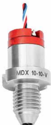
Рис. 6. Тензопреобразователь MDX с корпусом из нержавеющей стали

шее качество по уровню деформаций, сохраняет упругие свойства в широком диапазоне температур (от -200 до 400 °С). Монокристаллические кремниевые тензорезисторы соединены с сапфиром на атомарном уровне (метод гетероэпитаксии) и работают практически без гистерезиса и усталостных явлений во времени. Уникальные изолирующие свойства и радиационная стойкость сапфира позволяют эксплуатировать чувствительный элемент при высоких электромагнитных помехах и воздействии радиации.