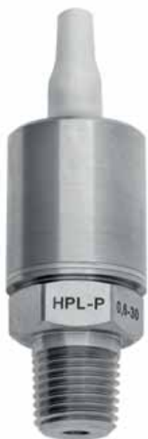
Рис. 2. Низкотемпературный тензопреобразователь избыточного давления HPL-P

Первая серия HPL-P (рис. 2) включает микроэлектронные низкотемпературные тензопреобразователи избыточного давления. Нижняя граница диапазона рабочих температур ( -200\text{ }^{\circ}\text{C} ) позволяет эксплуатировать их, например, в жидком азоте. Основные характеристики: диапазон рабочих давлений: от 0–0,1 до 0–60 МПа, диапазон рабочих температур: от -200 до +60\text{ }^{\circ}\text{C} .