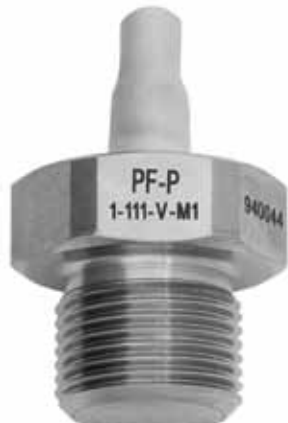
Рис. 7. Тензопреобразователи серий Р и PF-P с омываемой мембраной

датчиком температуры. Это позволяет использовать их для контроля двух физических величин: давления и температуры. Приборы серии MP-PT обеспечивают раздельное непрерывное преобразование избыточного давления газообразных и жидких сред и температуры в электрические выходные сигналы. Изготавливаются с гибким кабелем (0,5–2 м) для использования выносной электроники, имеют степень защиты корпуса IP65;