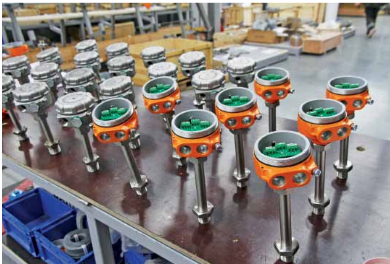
Рис. 2. Ультразвуковые сигнализаторы РИЗУР-900 в цехе контроля

Важно отметить, что на работу прибора не влияют турбулентные потоки, пена и внешние вибрации.