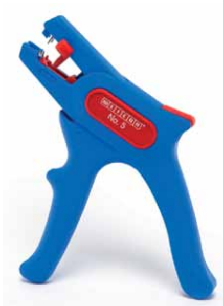
Рис. 1. Стриппер WEICON Super № 5: внешний вид

Легкий и удобный инструмент клещевого типа (рис. 1) для снятия ПВХ-изоляции гибких и жестких монтажных проводов с сечением жилы от 0,2 до 6,0 мм 2 . Конструкция стриппера обеспечивает автоматическую адап-