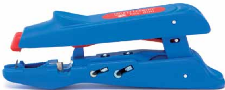
Рис. 4. Стриппер WEICON № 300: внешний вид

WEICON № S4-28 обладает максимально безопасным дизайном: лезвия полностью задвигаются в корпус, выполненный из ударопрочного пластика, армированного стекловолокном, — ни разбить, ни случайно порезаться невозможно. Инструмент может быть использован для электромонтажных работ при строительстве коттеджей и загородных домов, обустройстве сетей электропитания в городских квартирах, офисах и общественных зданиях.