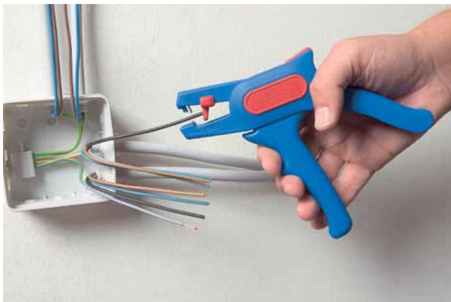
Рис. 2. Длина снимаемой изоляции устанавливается с помощью передвигаемого упора