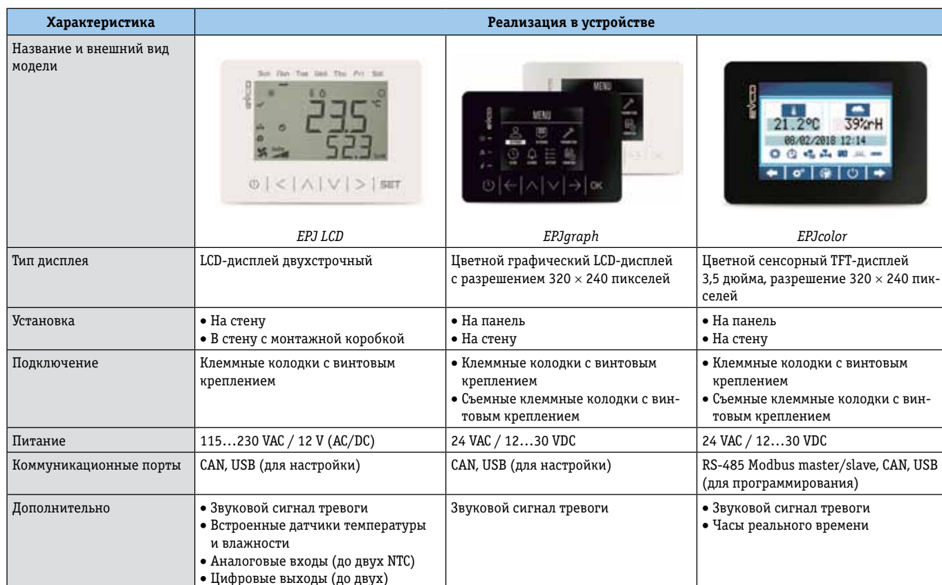
Таблица 2. Характеристики панелей управления для работы с ПЛК EVCO

Работа с ПЛК была бы невозможна без надежной, дружелюбной, интуитивно понятной среды разработки UniPro3. Проекты в этой среде разработки создаются на понятном для исполнителя языке функциональных блоков (FBD), если алгоритм необходимо оптимизировать, проект можно реализовать на языке Си. Сама среда имеет русифицированный интерфейс и большой набор готовых библиотек, включающий библиотеку учета наработки часов, библиотеку автонастройки ПИД-регулятора, библиотеку расписания, библиотеку ротации, библиотеку управления компрессором, библиотеку управления насосом, ступенчатого регулирования, работы чиллера, конденсатора, агрегата и многие другие. Учтено и такое пожелание пользователей, как возможность написания и сохранения индивидуальных библиотек. Кроме программирования ПЛК данную среду разработки удобно использовать для создания интерфейсов для сенсорных панелей. Отладка программы осу-