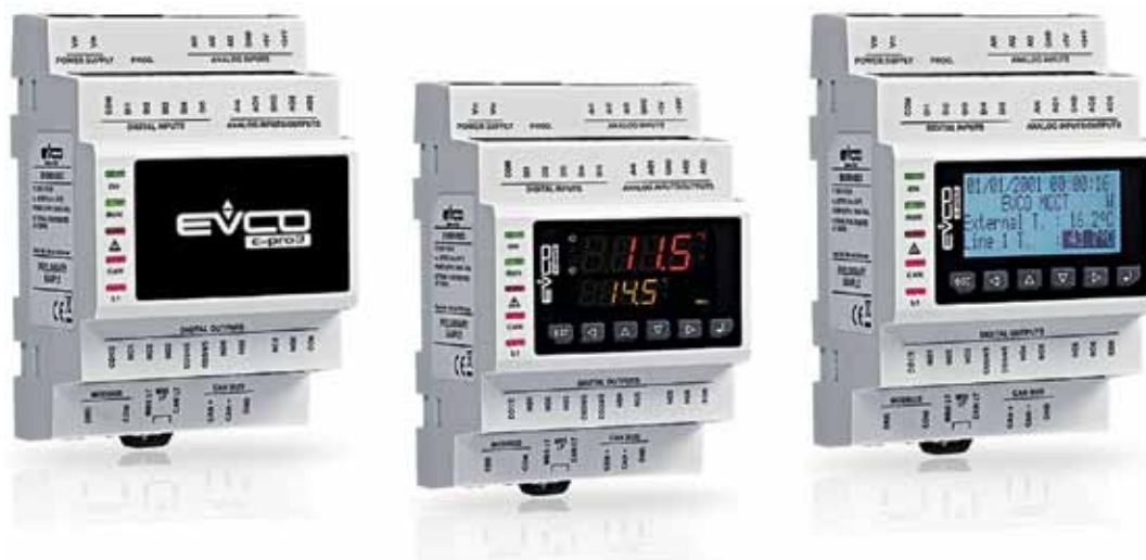
Рис. 2. Контроллеры C-pro3 серии «Kilo» в разных исполнениях

пы: «Nano» и «Micro»; «Kilo» и «Kilo Node»; OEM.