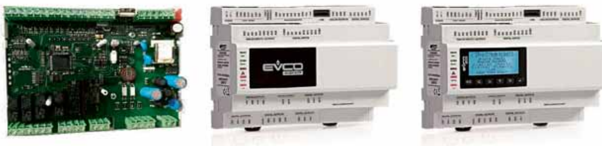
Рис. 3. Контроллеры серии OEM в различных исполнениях

Эти программируемые контроллеры эконом-класса выполнены на открытой плате либо в корпусном исполнении с дисплеем или без (рис. 3). Большие размеры платы позволяют размещать на ней все контактные группы, а также внутренний блок силового питания 115–230 В переменного тока. При своей невысокой стоимости контроллеры серии C-pro3 OEM оборудованы большим числом вводов/выводов и предназначены для решения широкого круга задач в индустрии климатических систем, в том