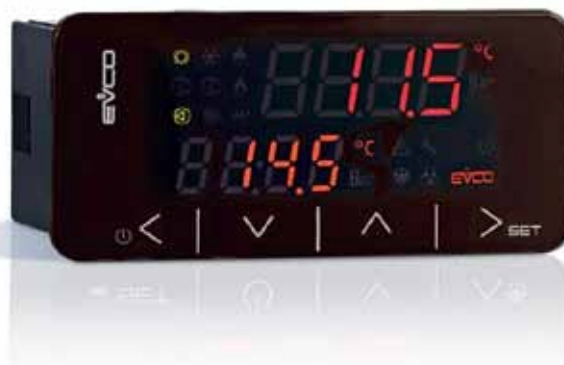
Рис. 1. Контроллер C-pro3 «Nano»