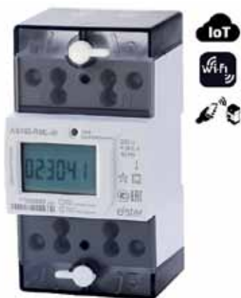
Рис. 1. Счетчик электроэнергии АЛЬФА СМАРТ AS100

С внедрением IoT-технологий в традиционную иерархию рынка «производство – передача – сбыт электроэнергии» с его жестким регламентом взаимодействия, снижающим оперативность работы, придет система автоматического контроля в режи-