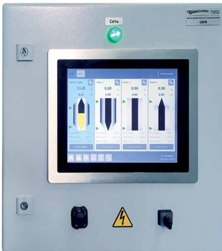
Рис. 4. «Силос-мастер»: внешний вид шкафа визуализации

Одним из примеров использования MasterKingdy является совместная с компанией «Промситех» разработка – «Силос-мастер: коробочная версия» (рис. 4). Данный ПТК предназначен для измерения и мониторинга уровня заполнения силосов и ёмкостей сыпучими и жидкими материалами на комбикормовых, цементных, пивоваренных заводах, деревообрабатывающих предприятиях, угольных ТЭЦ, предприятиях по производству угольного и нефтяного кокса, химических производствах и т. д. «Силос-мастер» позволяет задавать точную геометрию типовых силосов, что обеспечивает получение достоверных данных об уровне материала без погрешностей. Система защищена от случайных вмешательств малоквалифицированного персонала или других видов вмешательства за счет использования конфигурационных решений.