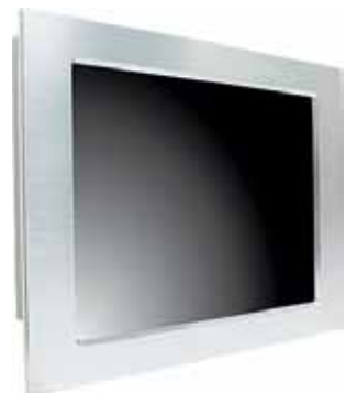
Рис. 2. Панельный промышленный ПК Kingdy