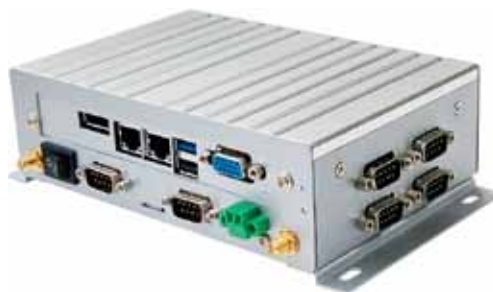
Рис. 1. Промышленный ПК Kingdy

позволяют применять ПТК для любых задач автоматизации. В линейке промышленных панельных компьютеров представлены как модели на базе процессоров Intel J1900 или E3845 с низким энергопотреблением, так и высокопроизводительные модели на базе энергоэффективных процессоров Core i3/i5/i7 4-го и 6-го поколений. Для решения широкого спектра задач по мониторингу, управлению и эффективной обработке данных на компьютерах Kingdy присутствует весь необходимый для этого набор интерфейсов, таких как USB, LAN, COM, VGA, DVI. Компьютеры Kingdy изготавливаются с различной степенью защиты: IP65 – по лицевой панели, полностью защищенные компьютеры со степенью защиты IP65, а для тяжелых условий эксплуатации – со степенью защиты IP66.