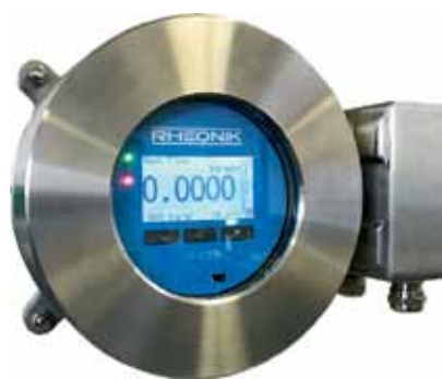
Рис. 8. RHE27 и RHE28