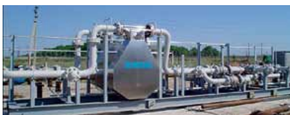
Рис. 2. Линия перекачки готовых нефтепродуктов: коммерческий учет