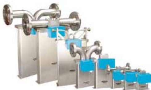
Рис. 5. Линейка типоразмеров RHM

Т. Штоер: Рынок измерительной техники — это высокоинтеллектуальный, специализированный бизнес. Учитывая данный нюанс, мы прежде всего уделили внимание механической части расходомера, его главному преимуществу — измерительным трубкам, в частности их форме. Мы изобрели принципиально новый вид измерительного контура — \Omega -образный. Эта форма прежде всего дает возможность генерировать, концентрировать и сохранять колебания высокой частоты, что позволяет нам иметь стабильный, сильный выходной сигнал с измерительного контура, затрачивая при этом значительно меньше электроэнергии на работу генерирующих колебаний катушек. Например, если сравнивать с аналогичными типами массометров других производителей, мы экономим на порядок (в 10–20 раз) больше электроэнергии на работу расходомера. Да, на малых типоразмерах это не так ощутимо, но, когда расходомер на Ду 100, 200 или 300 мм и таких расходомеров на вашем предприятии несколько десятков, это дает ощутимую разницу в стоимости владения и значительно снижает операционные расходы.