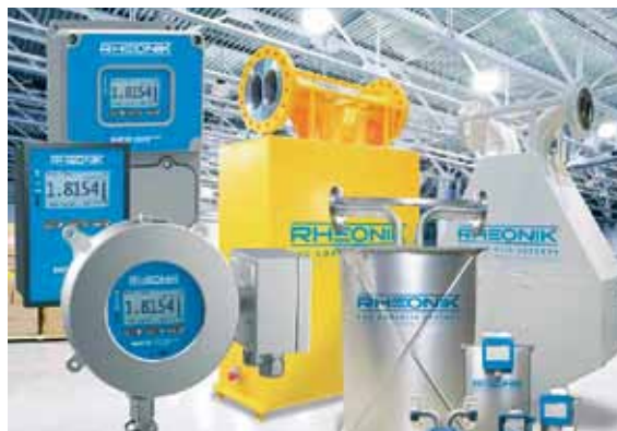
Рис. 1. Кориолисовые расходомеры RHEONIK

Т. Штоер: Это действительно так. Направление точных измерений расхода жидкостей и газов постоянно развивается, и мы тоже развиваемся вместе с ним. Стандартно для массового расходомера серии RHM в исполнении Gold Line точность по массе равна 0,1%. Такие показатели достигаются путем использования специальной омегаобразной ( \Omega -образной) системы измерительных трубок, двух измерительных катушек и торсиона с инерционной массой – так называемого ‘mass bar’.