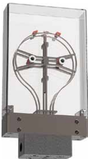
Рис. 3. Устройство RHM