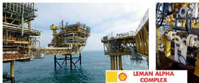
Рис 7. Расходомер на нефтяной платформе

ИСУП: Каков межповерочный интервал у расходомеров RHEONIK?