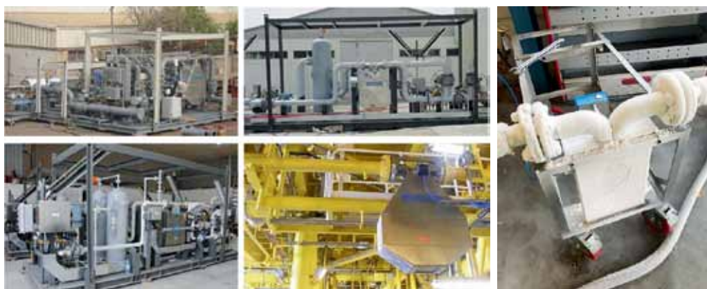
Рис. 6. Примеры применений

ное), а также кламповое соединение и соединение по DIN 11851 для работы в пищевой и фармацевтической промышленности и многие другие.