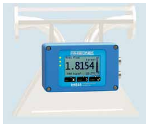
Рис. 9. RHE45: полностью локальный цифровой преобразователь

Т. Штоер: На данный момент 5 лет. При этом средний срок службы расходомера — не менее 15 лет. Нами зафиксированы случаи, когда расходомеры работают более 30 лет, при этом температурный режим у них выше +350 °С. И после калибровки такие расходомеры продолжают безустанно работать, не требуя никакого дополнительного обслуживания.