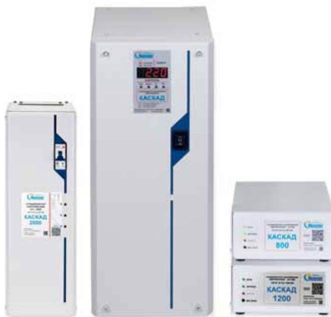
Рис. 4. Электронные стабилизаторы напряжения «Каскад»

► мощность нагрузки: для этого нужно сложить мощности всех электроприборов, которые будут работать одновременно;