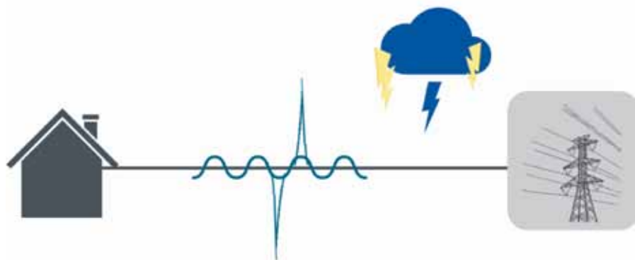
Рис. 1. Схематичное изображение импульсного перенапряжения

К сожалению, сегодня в эксплуатации находится множество электросетей, спроектированных десятки лет назад, а уровень нагрузки значительно вырос. Яркий пример – сети различных садоводств и других загородных потребителей. Недостаточное сечение линий и, как результат, потери