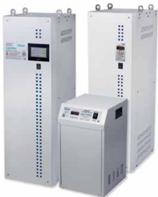
Рис. 3. Промышленные стабилизаторы напряжения «Сатурн» серий 1000 и 500