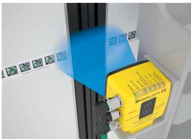
Рис. 4. Система позиционирования допускает широкие промежутки между частями кодовой ленты

Большое внимание наряду с безопасностью и надежностью разработ-