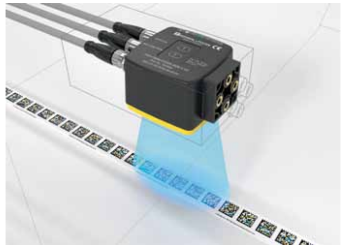
Рис. 3. Новая система позиционирования сканирует одновременно до пяти матричных кодов

алгоритма, признанного безопасным. Проверка достоверности данных каждого кода происходит непосредственно в отвечающем за безопасность элементе датчика, и только после этого данные передаются на контроллер безопасности по протоколу PROFIsafe (рис. 2). Здесь безопасное положение по оси X проходит дальнейшую обработку и задействуется для управления рабочим процессом. Инновационная сенсорная технология снабжена функцией непрерывного самоконтроля, что является показателем высокой надежности.