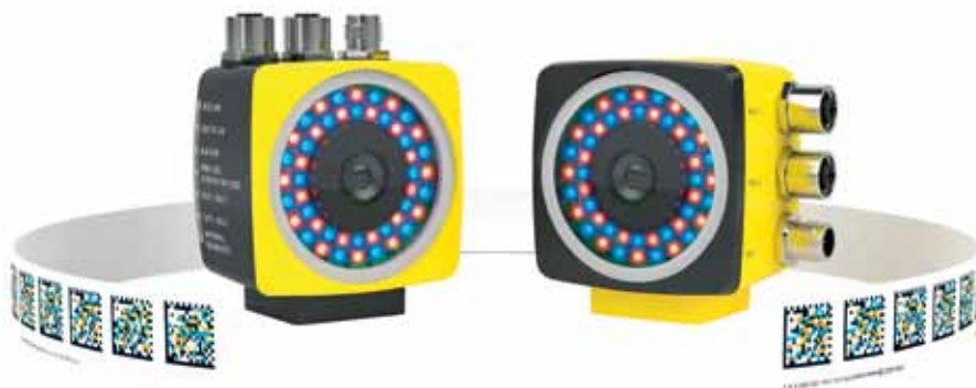
Рис. 1. Компоненты системы позиционирования safePGV: 2D-считыватель и лента с кодами матрицы данных

«Мозг» системы позиционирования – это новое фирменное программное обеспечение. Оно управляет цветом светодиодов с помощью