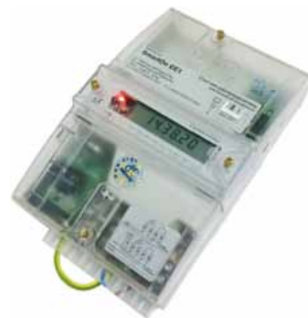
Рис. 1. Электросчетчик SmartOn EE1

Остановимся подробнее на интерфейсах счетчика. Он оборудован оптопортом и 1–2 независимыми каналами, которым можно задать любую конфигурацию: RS-485, RS-232, RMA, GSM/GPRS, PLC, Wi-Fi, Bluetooth, Ethernet, LoRa. Возможно использование протоколов: DLMS/COSEM/СПОДЭС, Modbus RTU, BIN2, МЭК 60870-5-104. Несмотря на то что счетчик однофазный, он сохраняет работоспособность при напряжении до 380 В.