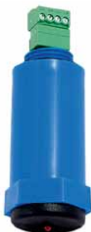
Рис. 2. Радиомодуль АКМ-4

На рынке есть решения по индивидуальному управлению светильниками, созданные в соответствии с европейскими стандартами NEMA-7, LoRa. НТЦ «Арго» предлагает рынку отечественное решение как в евро-