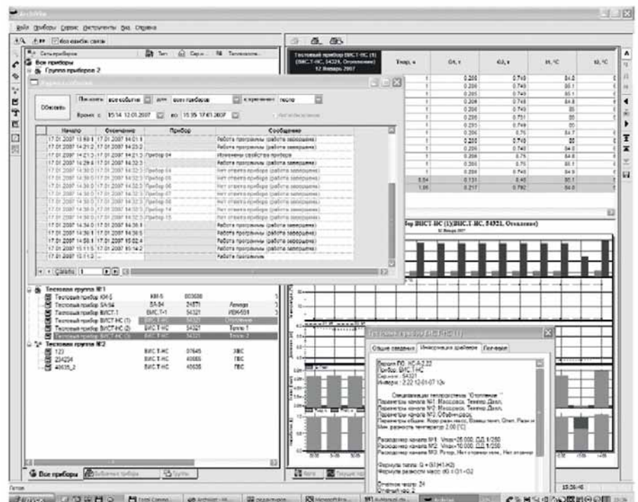
Рис. 1. Рабочее окно программного комплекса «Система диспетчерского учета «Архивист»»

В число решаемых программным комплексом задач входят автоматизи-