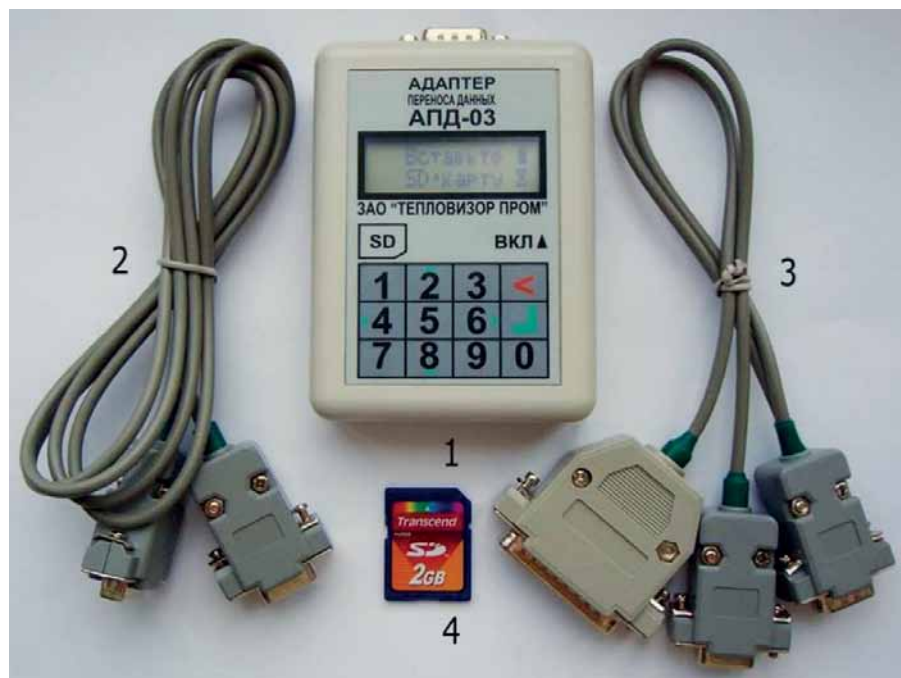
Рис. 2. Комплект поставки адаптера переноса данных АПД-03: 1 – адаптер переноса данных; 2 – кабель для подключения адаптера к прибору (порт «Модем») или компьютеру; 3 – многофункциональный переходник для подключения к прибору (порт «Принтер») или принтеру Epson LX-300; 4 – SD-карта с резервной копией установленной рабочей программы

В качестве исполнительных устройств в ДС «Архивист» используются теплосчетчики серии ВИС.Т-ТС, предназначенные для измерения характеристик потока теплоносителя и количества тепловой энергии в системах теплоснабжения. Приборы производятся в стандартном и погружном исполнении. Отличаются высокой стабильностью метрологических характеристик, межповерочный интервал теплосчетчиков составляет 6 лет. Теплосчетчики серии ВИС.Т-ТС устойчивы к помехам, которые могут оказывать влияние на результаты измерений. Конструкция измерительных устройств предусматривает: металлический антивандалный корпус, обеспечивающий работу прибора в сложных условиях эксплуатации, первичные преобразователи со степенью защиты IP68 и электронный блок со степенью защиты IP65. Четырехстрочный ЖК-дисплей используется для вывода информации и настройки прибора. На верхний уровень информация об измерениях передается по интерфейсам RS-232 (компьютер, модем, принтер), Ethernet, RS-485