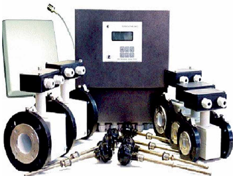
Рис. 3. Многоканальный электромагнитный теплосчетчик ВИС.Т3-ТС в погружном исполнении с исполнительными устройствами