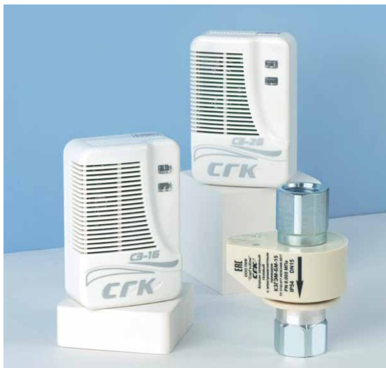
Рис. 3. Система автономного контроля загазованности бытовая СГК-2-Б-СО-СН включает в свой состав: сигнализатор загазованности природным газом СЗ-1Б; сигнализатор загазованности оксидом углерода СЗ-2Б; клапан запорный газовый электромагнитный КЗГЭМ-Б или КЗГЭМ-БМ; кабели соединительные (на фото не указаны)

▶ выдачу световой и звуковой сигнализации в случае возникновения в контролируемом помещении концентрации газа, превышающей пороговые уровни, а также при обрыве или коротком замыкании чувствительного элемента, неисправности клапана электромагнитного, обрыве или нарушении линии связи между блоками;