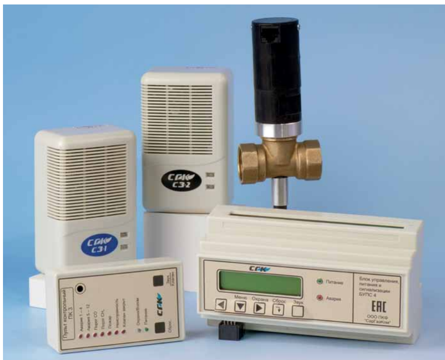
Рис. 4. Система автономного контроля загазованности SGK-3