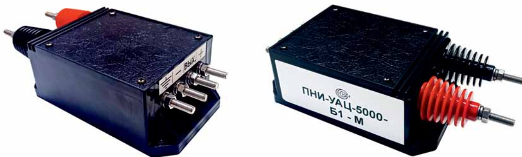
Рис. 3. Внешний вид цифрового датчика серии ПНИ для измерения действующего значения напряжения до 6000 В, созданного на платформе предыдущего датчика ПИН-3000-УА-Б1-М: габариты 179 × 78 × 50 мм, подача измеряемого напряжения – непосредственно на вход датчика

них привыкли к аналоговому датчику напряжения предыдущей серии. Поэтому все посадочные места нового преобразователя напряжения ПНИ (рис. 3) остались прежними. Основные технические характеристики и функциональность тоже сохранены, что позволяет сделать переход на новые датчики наиболее безболезненным.