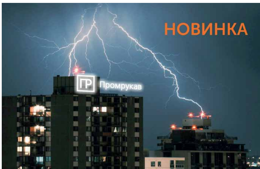
Рис. 1. Система молниезащиты и заземления Промрукав

В большинстве случаев молнии образуются внутри грозовых туч, а также в пространстве больших слоисто-дождевых облаков и облаков кучво-дождевого типа. Согласно аналитическим данным мониторинга погоды, с конца XX века в большинстве регионов планеты происходит активное изменение ранее устойчивых климатических условий. Перемена климата влечет за собой более частое образование облаков и интенсивное перемещение воздушных масс, что в свою очередь приводит к повышению вероятности формирования осадков