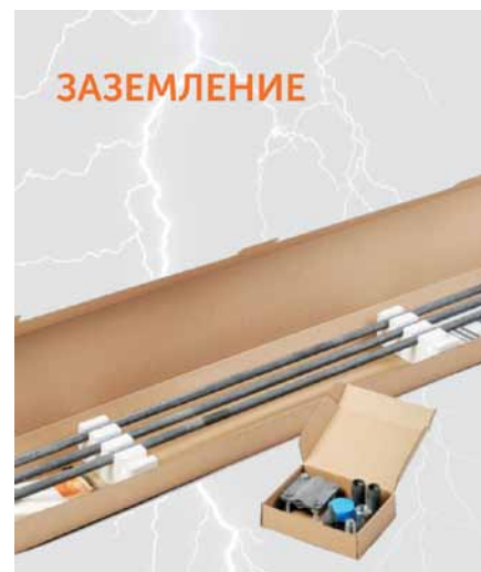
Рис. 4. Комплект заземления Промрукав: вариант исполнения

и искровых разрядов. Эти изменения затрагивают все континенты и страны, в том числе территорию России.