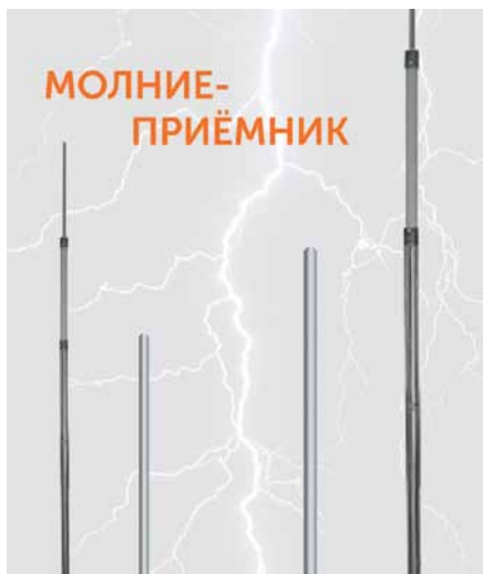
Рис. 2. Примеры молниеприемников Промрукав