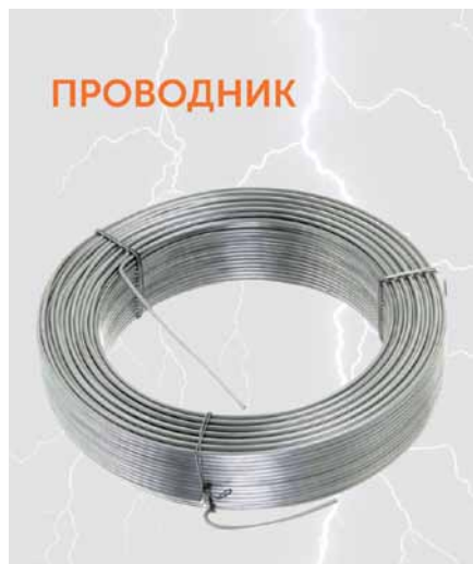
Рис. 3. Проводник Промрукав: пример исполнения