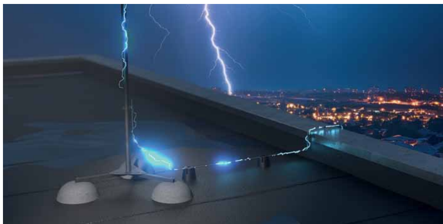
Рис. 5. Вариант монтажа молниезащиты Промрукав

Компания Промрукав стремится реализовать всесторонний подход к обеспечению безопасности зданий и сооружений во время грозы. В решениях компании учтены нормы и требования всех основных ГОСТов, ПУЭ, инструкций и сводов правил: РД 34.21.122-87, СО 153-34.21.122-2003, ГОСТ Р МЭК 62305-1-2010, ГОСТ Р МЭК 62305-2-2010, ГОСТ Р 59789-2021 (МЭК 62305-3:2010), ГОСТ Р МЭК 62305-4-2016, ГОСТ Р МЭК