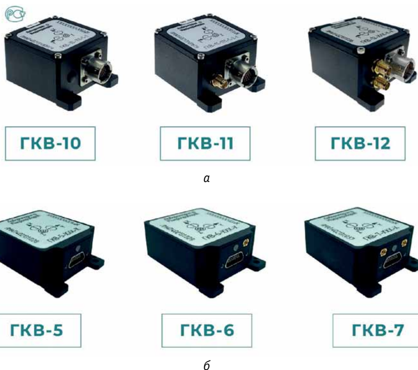
Рис. 2. Базовая линейка модулей семейства ГKB: а – ГKB-10, ГKB-11, ГKB-12; б – ГKB-5, ГKB-6, ГKB-7