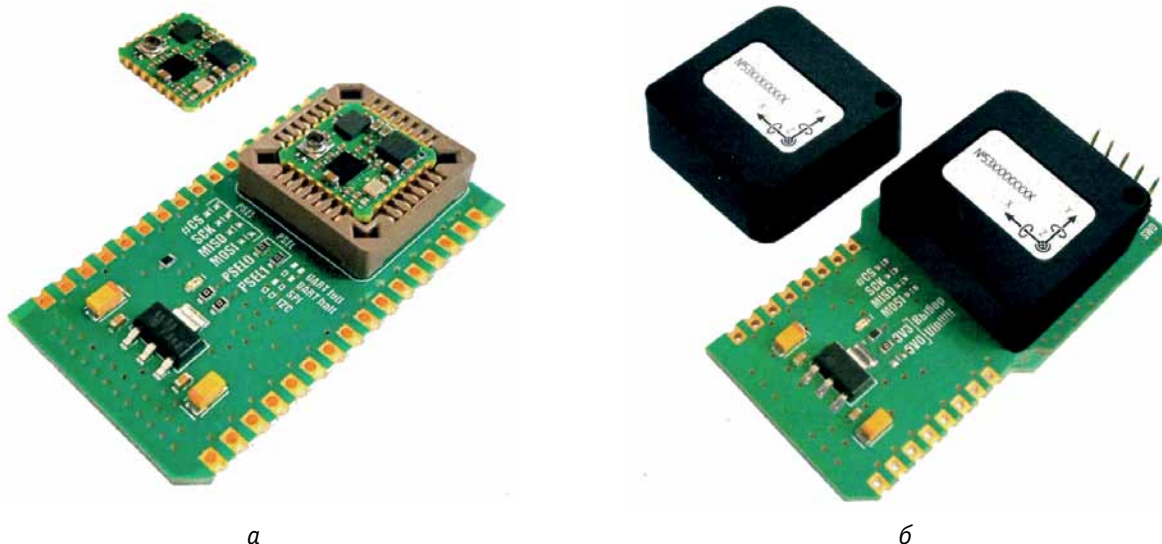
Рис. 4. Новинки «ЛМП»: а – инерциальный SMT-модуль ГКВ, аналог Xsens MTi-1; б – инерциальный встраиваемый модуль ГКВ, аналог Epson G330/G365/G366/G370

полета в зоне приема достоверных сигналов ГНСС и автоматическая подстройка датчика воздушного потока (ДВП).