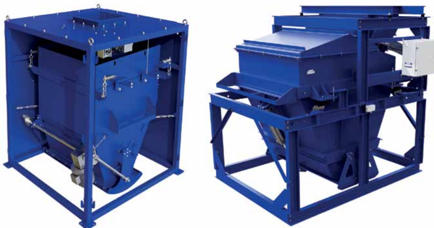
Рис. 1. Бункерные автоматические электронные весы (справа – модификация для взвешивания свеклы)

Конструкция бункерных весов ВДЭ включает в себя грузоприемное устройство из конструкционной ста-