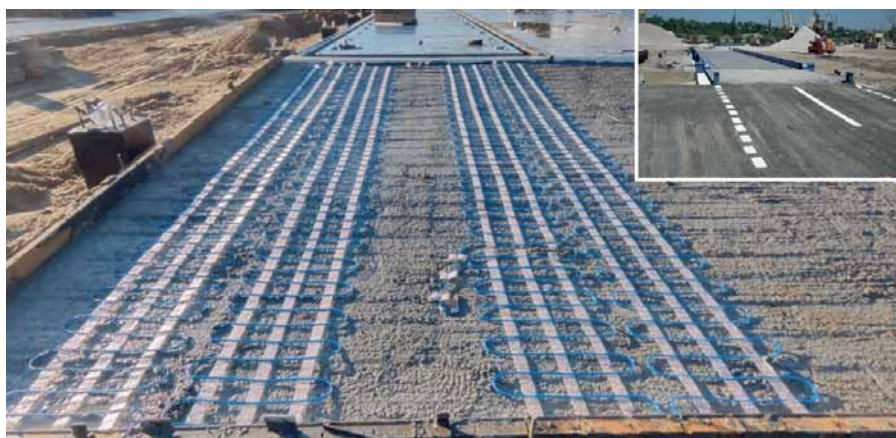
Рис. 4. Устройство подогрева подъездных путей

Нижние полки балок дополнительно усилены листами толщиной 10 мм, при этом толщина верхнего листа настила составляет 16 мм.