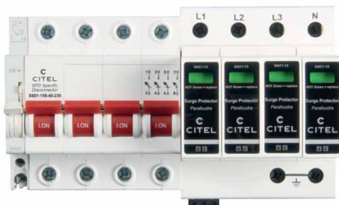
Рис. 3. Четырехполюсные УБО и УЗИП CITEL

Визуальный и удаленный контроль. Наличие опционального сигнального контакта делает диагностику максимально удобной.