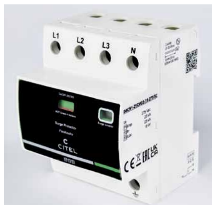
Рис. 1. Компактное УЗИП CITEЛ со счетчиком импульсов и технологией VG, I_{imp} 25 кА

При эксплуатации УЗИП важно обеспечить надежное и автоматическое отключение деградировавшего варистора. В большинстве схем для