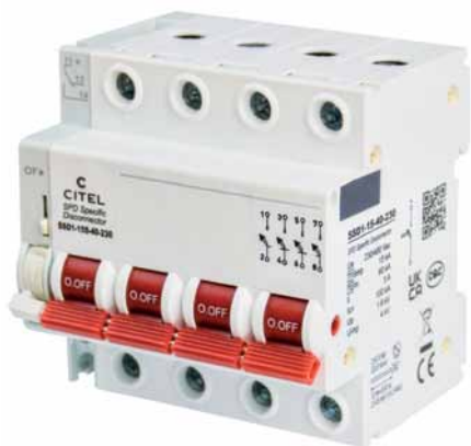
Рис. 2. Четырехполюсное УБО (устройство безопасного отключения) CITEL

этого используются плавкие вставки или автоматы, что сопряжено с ограничениями. CITEL предлагает альтернативу – устройство безопасного отключения (УБО, или по-английски SPD specific disconnect). Какие преимущества дает УБО?