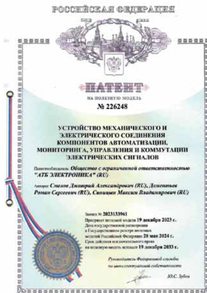
Рис. 4. Патенты, полученные «АТБ Электроника» на соединительный модуль, конструкцию корпусов контроллера и модулей расширения

но непосредственно с помощью дисплея, встроенного в контроллер, и поворотного-нажимного энкодера, размещенного на корпусе устройства.