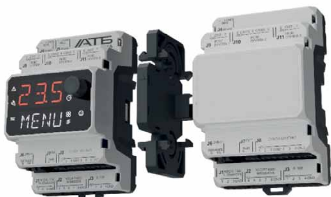
Рис. 2. Соединение контроллера АТБ-2100 и модуля расширения АТБ-2101 с помощью соединительного модуля АТБ-2103

входят контроллеры, модули расширения и, конечно же, соединительные модули (рис. 2).