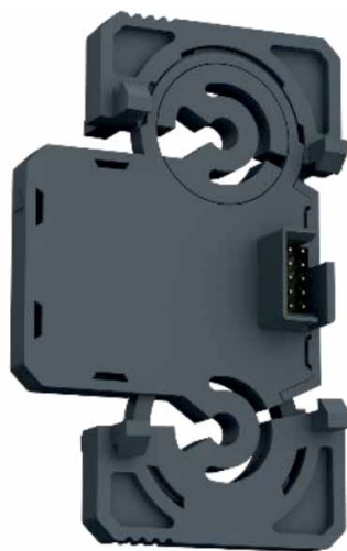
Рис. 1. Соединительный модуль АТБ-2103

Масштабное внедрение технологии, разработанной компанией «АТБ Электроника», возможно при использовании программно-аппаратной платформы АТБ-2100. В платформу