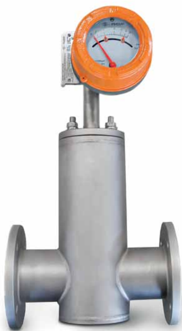
Рис. 2. Ротаметр РИЗУР-РПС-250 в горизонтальном исполнении с выносной измерительной камерой

воде. Технология измерения расхода при этом остается одинаковой, но монтаж приборов разный: ротаметр в вертикальном исполнении монтируется соответственно на вертикальном участке трубы, поток по которой движется снизу вверх, а ротаметр в го-