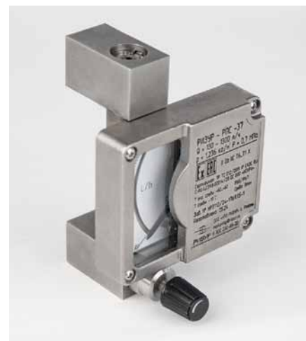
Рис. 3. Ротаметр РИЗУР-РПС-37 с разных ракурсов

ризонтальном исполнении предназначен для монтажа на горизонтальном участке трубопровода, направление потока должно быть слева направо.