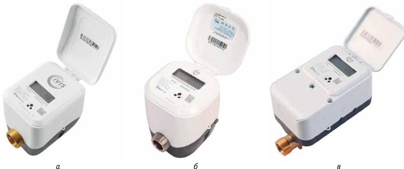
Рис. 2. Расходомеры-счетчики: а – iVIS 100; б – iVIS 110; в – iVIS 150

контакта между пьезоэлементом и измеряемой средой;