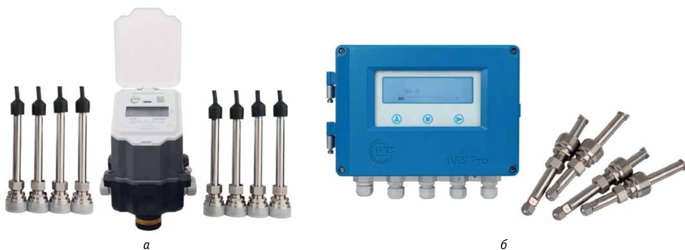
Рис. 4. Расходомеры-счетчики: а – iVIS 300; б – iVIS Pro

пературу измеряемой среды вплоть до +90 °С. Затвор и золотник затвора изготовлены из нержавеющей стали. Интерфейсы и индикация такие же, как у рассмотренных выше у моделей.