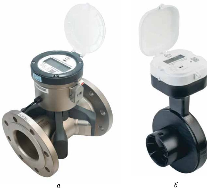
Рис. 3. Ультразвуковые расходомеры-счетчики: а – iVIS 200; б – iVIS 250

воды, в том числе по предоплатным тарифам. Встроенная в прибор функция управления затвором позволяет ресурсоснабжающим компаниям повысить эффективность взимания платы за воду за счет сокращения времени оплаты и реализации возможности предварительных расчетов. Расходомер имеет высокую чувствительность в области малых расходов (от 0,0015 м 3 /ч). Приборы серии iVIS 150 выпускаются в исполнениях с номинальными диаметрами DN15, DN20 и DN25 и динамическими диапазонами 250:1 и 400:1. Выдерживают тем-