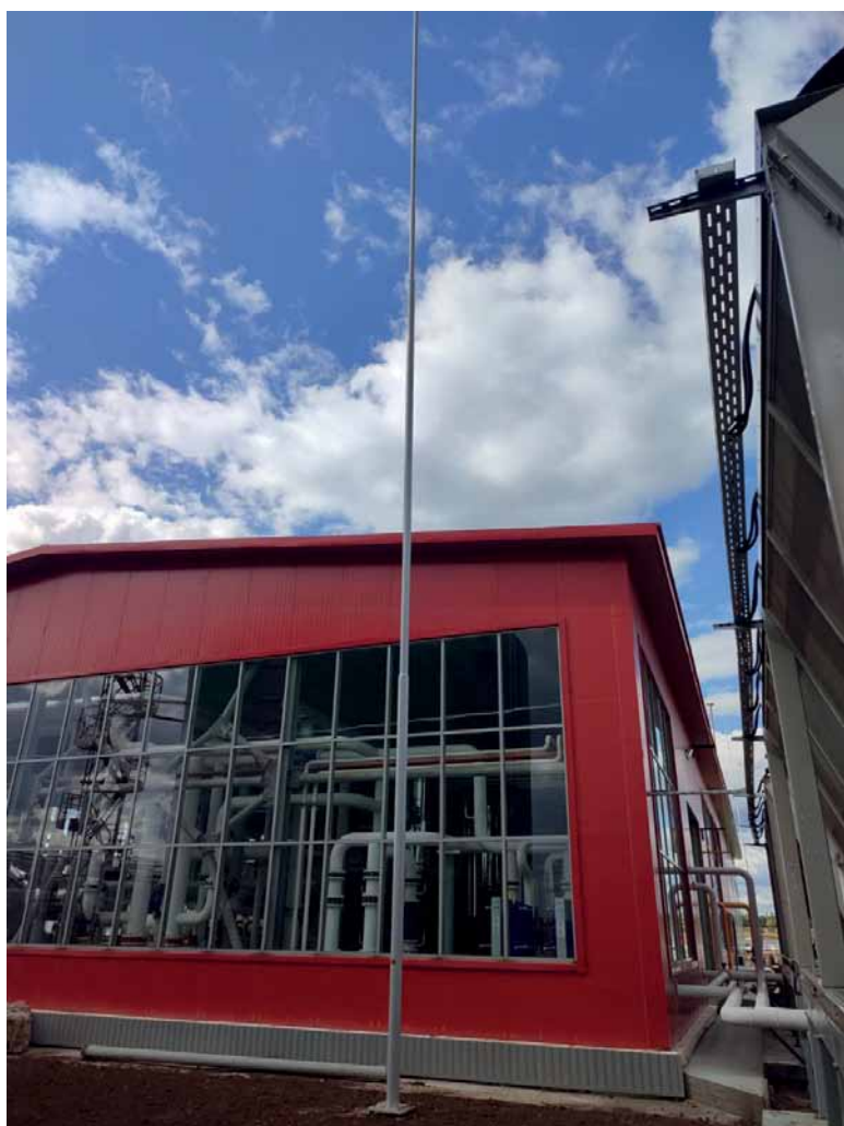
Рис. 2. Молниезащита здания временного назначения, г. Владимир