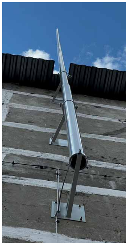
Рис. 1. Стеновой приемник в системе молниезащиты производственного здания, г. Александров

емники высотой до 25 м (рис. 1). Они предназначены для защиты зданий, где установка отдельностоящих конструкций может быть затруднена или нежелательна. Такие молниеприемники легко монтируются на фасад здания или сооружения и обеспечивают эффективное отведение электрического заряда в землю, предотвращая повреж-