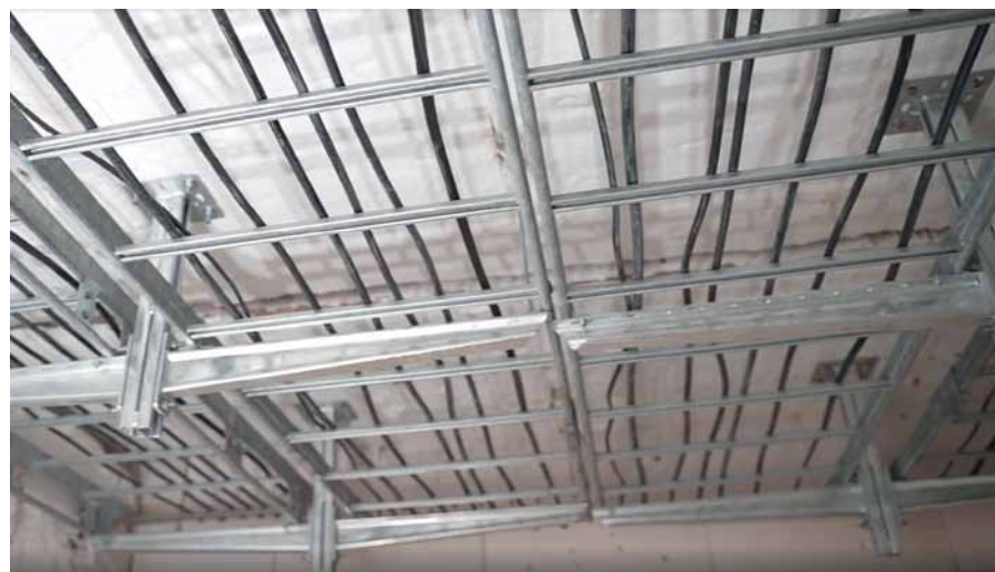
Рис. 5. Пример установки КНС в составе огнестойкой кабельной линии на объекте

Существенное преимущество компании «МЕКА» – это возможность использования неординарных и системных решений при реализации сложных проектов кабеленесущих систем в критически важных для страны областях, в которых предъявляются повышенные требования к размещению оборудования, его надежности, сейсмостойкости и взрывопожаробезопасности. К таким объектам можно отнести предприятия ОПК, нефтегазовой, химической и горнодобывающей промышленности, центры обработки данных, медицинские учреждения, а также объекты, расположенные в особых климатических условиях, например, арктических. Отработанные линейки выпускаемых под брендом «МЕКА» кабеленесущих систем для различных условий эксплуатации с различными характеристиками, наряду с широкими компетенциями и квалификацией персонала компании, обеспечивают удовлетворение самых строгих требований заказчиков.