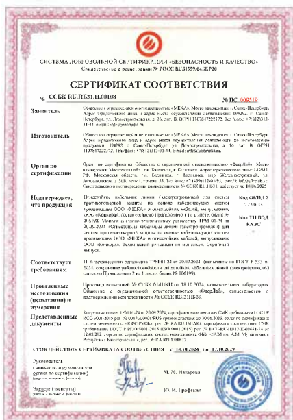
Рис. 1. Сертификат соответствия на огнестойкие кабельные линии производства ООО «МЕКА»