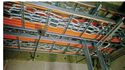
Рис. 2. Испытание КНС «МЕКА» на огнестойкость