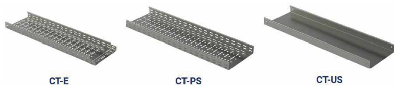
Рис. 4. Серии кабельных лотков СТ

установки КНС. В качестве аксессуаров используются различные наборы монтажных профилей, опорных и угловых элементов, подвески, а также различные пластины, крепления, крышки, соединители и другие изделия.