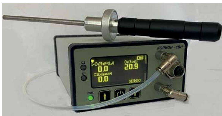
Рис. 2. Переносной газоанализатор КОЛИОН-1ВН

Однако использование ФИД газоанализаторов КОЛИОН для контроля ПДК ограничено веществами с ПДК не менее 10 мг/м 3 . Такое ограничение нижнего значения ПДК связано с тем, что ФИД – неселективный детектор, он не разделяет вещества. Если в воздухе находится смесь веществ, то, независимо от того, на