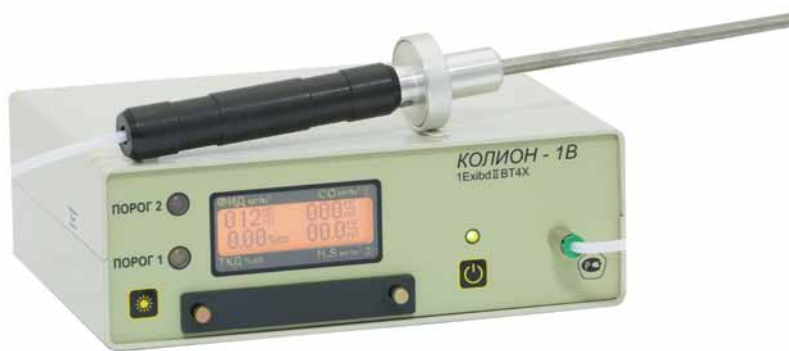
Рис. 1. Переносной газоанализатор КОЛИОН-1

Как уже отмечалось, ФИД обладает высокой чувствительностью к очень большому числу веществ. К ним относятся пары углеводородов нефти и нефтепродуктов, органические растворители (сольвент, уайт-спирит, ацетон и пр.), алифатические (кроме метана, этана), ароматические и непредельные углеводороды, хлоралкены (винилхлорид, три- и тетрахлорэтилен), спирты, альдегиды и кетоны, простые и сложные эфиры, аммиак, сероуглерод и др. ПДК этих веществ в воздухе рабочей зоны различаются на