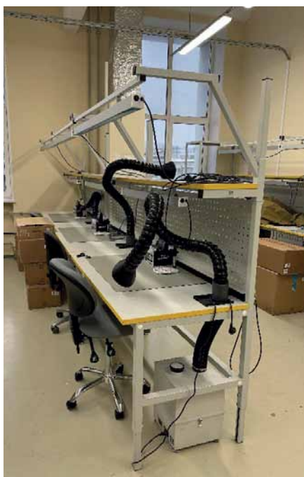
Рис. 4. Рабочие места серии Standart с дополнительным оснащением и антистатическими ковриками

В линейке изделий, изготовленных НПП «Универсал Прибор», представлены узлы заземления, которые устанавливаются под столешницей рабочего стола и поддерживают подклю-