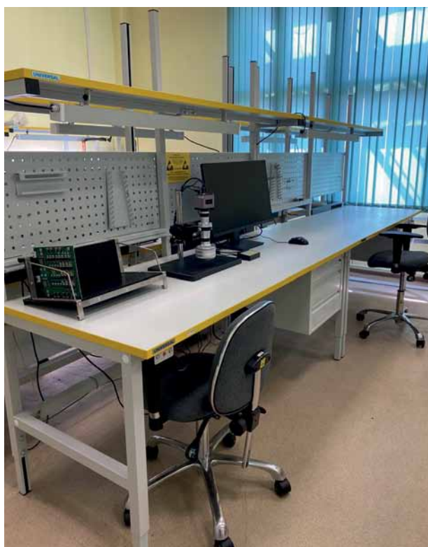
Рис. 2. Серия Standart: рабочее место регулировщика

Столы серии Standart имеют опору П-образной формы, которая позволяет регулировать высоту столешницы (рис. 2). На их стойки можно устанавливать полки, перфорированные