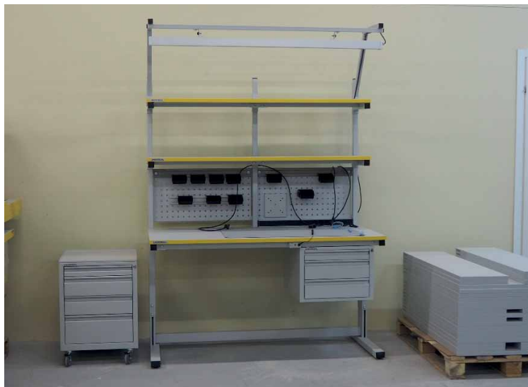
Рис. 3. Стол серии Ultra на этапе сборки

На любом рабочем месте большое значение имеют удобство и оптимизация хранения материалов, деталей, инструментов и готовой продукции. Для хранения в линейке промышленной мебели Universal предусмотрен широкий выбор изделий: тумбы, стеллажи, шкафы, кассетницы. Подвесные тумбы и драйверы разного типа позволяют удобно разместить инструмент, расходные материалы и документацию. Полочные стеллажи необходимы в складских и промышленных помещениях. Самое популярное решение – универсальные стеллажи с нагрузкой на полку от 50 до 250 кг и усиленные стеллажи с нагрузкой 300...500 кг. В линейке Universal есть архивные шкафы для хранения большого объема документов, шкафы с ящиками для инструмента, имеются специальные шкафы для комплектовочных и компонентов с 16, 22 и 30 ящиками. Есть и шкафы для хранения одежды со-