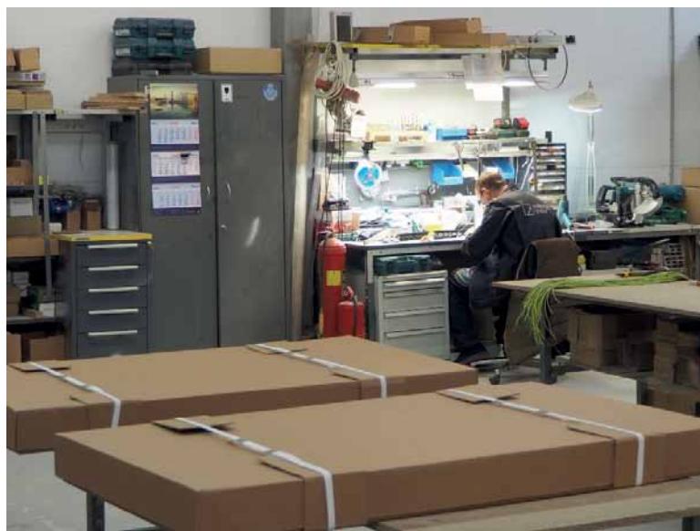
Рис. 1. Производство промышленной мебели марки Universal: участок электромонтажных и сборочных работ

Центральным предметом промышленной мебели является рабочий стол. Следуя общей тенденции рынка, в соответствии с которой производители делают разнообразные варианты промышленной мебели для разных специальностей (для электромонтаж-