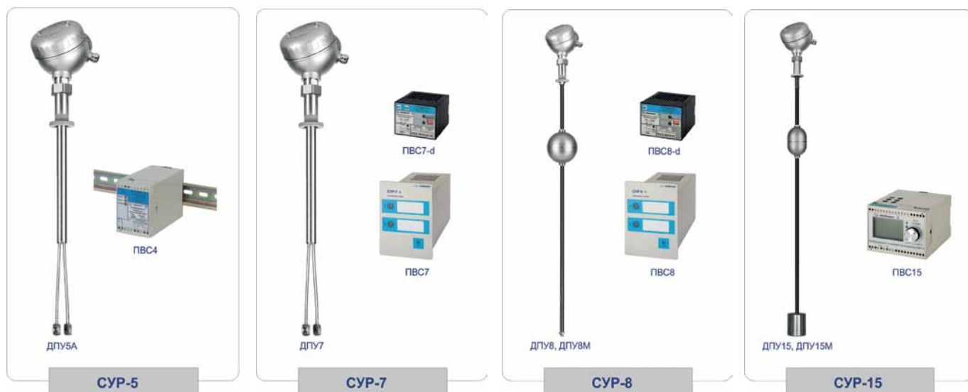
Рис. 1. Сигнализаторы СУР-5/7/8/15 со вторичными приборами

Может возникнуть законный вопрос: зачем столько моделей сигнализаторов с похожими чувствительными элементами и одинаковым принци-