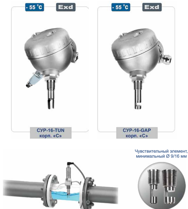
Рис. 3. Сигнализаторы СУР-16-TUN и СУР-16-GAP: внешний вид и установка

* По специальному заказу возможно изготовление приборов с расширенным диапазоном параметров.