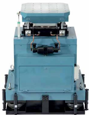
Рис. 4. Вертикальный пневматический ударный стенд серии VASI