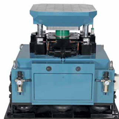
Рис. 3. Вертикальный пневматический ударный стенд VASII