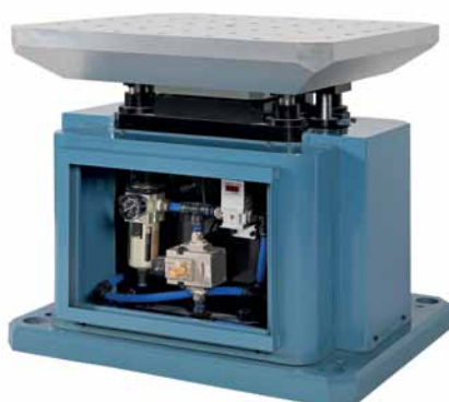
Рис. 5. Система ударных испытаний серии VAB

Серия вертикальных стендов свободного падения MS (рис. 6) включает в свой состав полностью автоматические ударные стенды, используемые для измерения и определения ударопрочности изделий и оценки эффективности упаковки. Эти стенды воспроизводят широкий диапазон ударных импульсов различных форм: полусинус, прямоугольный, трапеция, зуб пилы и др. При установке опциональных усилителей и натяжителей на стендах серии MS можно получать значение ускорения 10000 g и более.