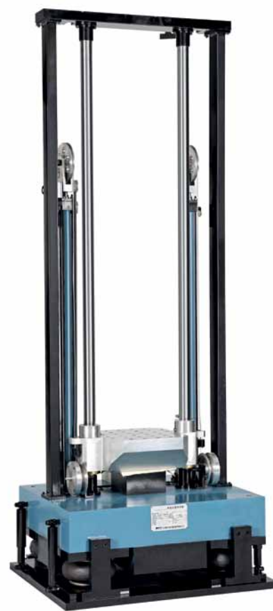
Рис. 6. Вертикальный стенд свободного падения серии MS

Особенностью этих испытательных ударных стендов являются их габариты: для обеспечения необходимого разгона стенд должен обладать достаточной высотой. Как правило, высота составляет от 2 до 4 м и более. Это необходимо учитывать при подготовке помещения испытательной лаборатории.