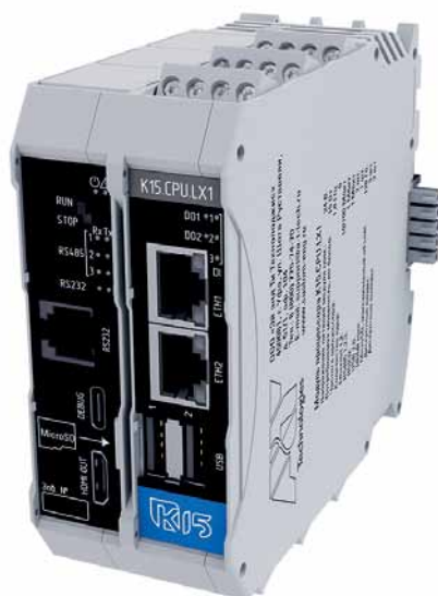
Рис. 1. Процессорный модуль K15.CPU.LX1

Модульный принцип построения, выбранный разработчиками линейки K15®, полностью оправдывает себя. Благодаря ему новый процессорный модуль ПЛК K15.CPU.LX1, мощный и компактный одновременно, представляет собой гибкое и кастомизированное решение, позволяющее выполнить любую задачу автоматизации,