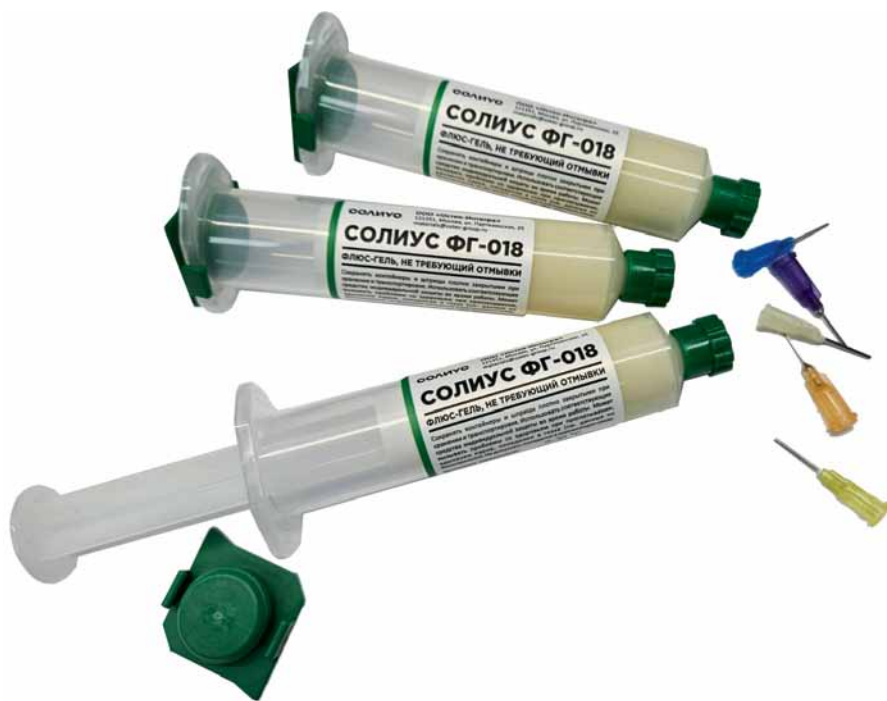
Рис. 1. Флюс-гель «Солиус ФГ-018» производства ООО «Остек-Интегра»

Д. А. Поцелуев: Чтобы ответить на эти вопросы даже кратко, одного интервью не хватит! Все карты о наших производственных планах раскрывать не буду, но скажу, что на текущий момент под брендом «Солиус» мы серийно производим в России паяльные флюсы и флюс-гели. И сегодня предлагаю поговорить об одном из наших первых серийных продуктов в линейке паяльных материалов «Солиус» (хотя и не во всей линейке продуктов для сборки печатных узлов) – о флюс-геле «Солиус ФГ-018» (рис. 1).