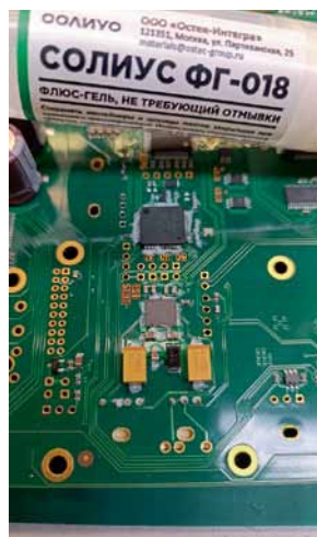
Рис. 2. Флюс-гель «Солиус ФГ-018» до процесса пайки

Д. А. Поцелуев: Первый удачный результат мы получили даже не с деся-