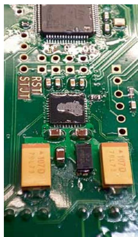
Рис. 3. Флюс-гель «Солиус ФГ-018» после пайки при 380 °C