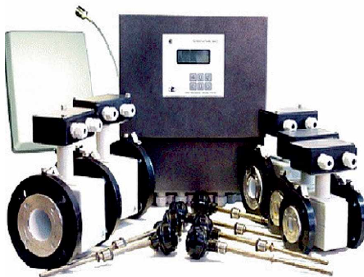
Рис. 2. Многоканальный электромагнитный теплосчетчик ВИСТ.ТЗ-ТС в погружном исполнении с исполнительными устройствами

Еще одна функция ДС «Архивист» – контроль за текущим состоянием измерительных устройств. При выходе параметров за уставки (при не-