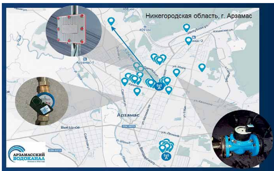
Рис. 3. Проект «Арзамасский водоканал» (передача данных на базовую станцию по радиоканалу LoRaWAN)

Конкретным примером эффективного внедрения разработок ООО «Декаст» можно назвать оснащение предприятия «Арзамасский водоканал» (г. Арзамас, Нижегородская обл.) системой учета потребления воды на базе водосчетчиков ОСВХ «НЕПТУН» (Ду 32–40, класс С) и СТВХ-50 «СТРИМ» с передачей данных по радиоканалу LoRaWAN (рис. 3). Система включает две базовые станции и 34 счетчика с установленными модулями МИД-Р и МИД-И, установленными в колодцах и подвалах. Максимальное расстояние от места установки прибора учета до базовой станции составляет 3 км.