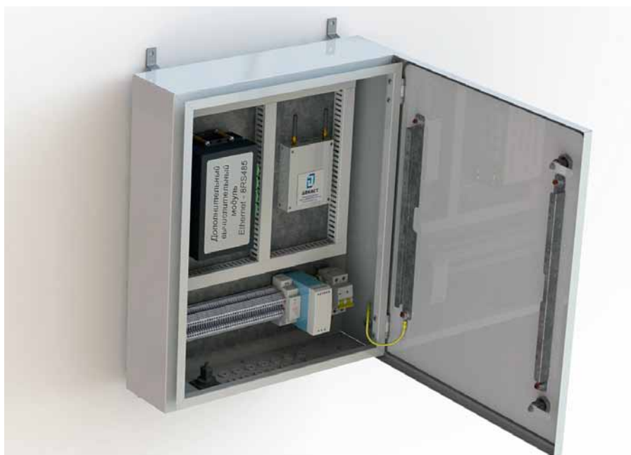
Рис. 2. Один из возможных вариантов монтажа УСПД «Декаст» в электротехническом шкафу

жать полное погружение под воду на глубину более 1 м на время не более получаса). Межповерочный интервал составляет 6 лет.