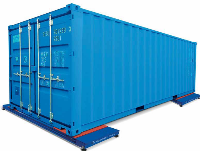
Рис. 5. Взвешивание груза на контейнерных весах

Переносные электронные весы серии ВСА-С40000, предназначенные для статического взвешивания, обладают грузоподъемностью до 40 т. Они применяются для взвешивания контейнеров в логистических и таможенных центрах, контейнерных терминалах, портах (рис. 5). Кроме того, они могут использоваться при взвешива-