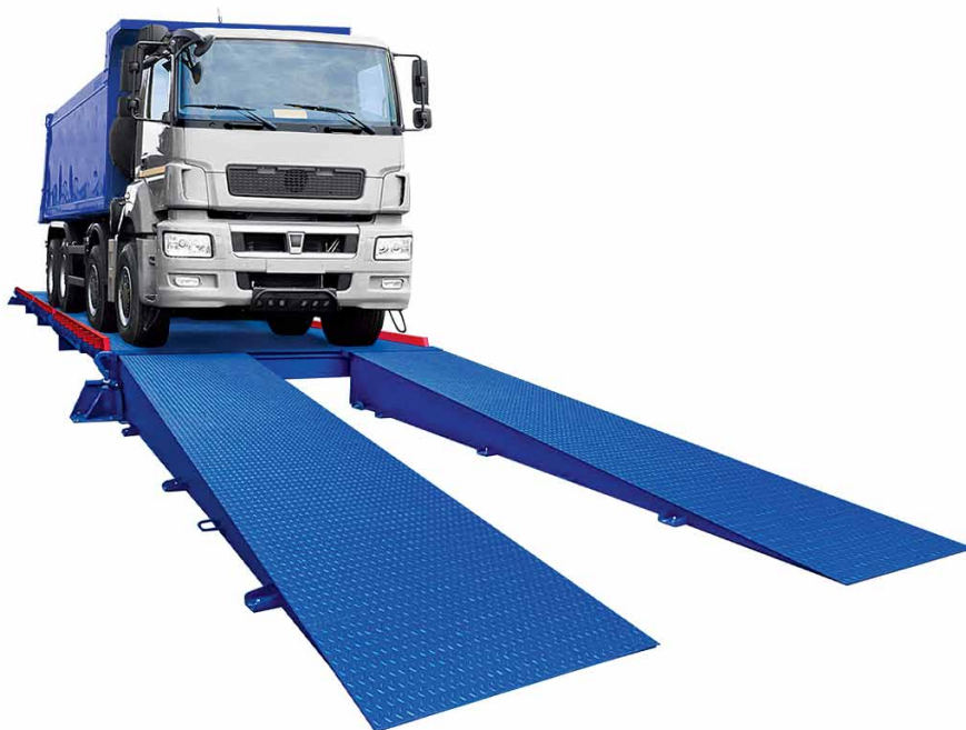
Рис. 1. Автомобильные платформенные весы ВСА-Р «Лакта»

В продуктовом портфеле компании представлено несколько линеек серийно выпускаемых автомобильных весов различных исполнений. Их технические характеристики перечислены в табл. 1.