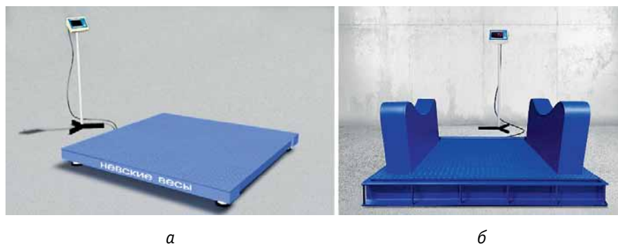
Рис. 2. Платформенные весы: а – универсальные напольные ВСП4-А; б – рулонные ВСП4-Т

На рис. 2 в качестве примера показан внешний вид платформенных универсальных и рулонных весов. Уникальной особенностью этих весовых устройств является повышенная жесткость платформы при небольшой металлоемкости. Конструкция обеспечивает высокий запас прочности: в 2,5 раза больше максимального веса при равномерно распределенной нагрузке и в 1,5 раза больше – при точечной.