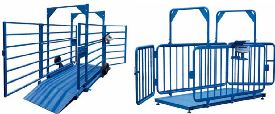
Рис. 3. Весы ВСП4-ЖСО с ограждениями для взвешивания крупного рогатого скота

Весы серии МК-Д / МК-ВТ, представляющие собой съемное грузозахватное приспособление, имеют грузоподъемность от 2 до 50 т. Они лишены индикации и производятся из толстолистовой стальной трубы, позволяющей выдерживать падения и сильные