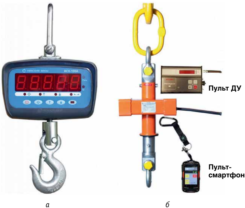
Рис. 4. Крановые весы: а – ВСК; б – МК-Д / МК-ВТ

ударные нагрузки. Степень пылевлагозащиты корпуса – IP67. Конструкция весов предусматривает наличие грузоприемного устройства, которое подвешивается на крановый крюк, и пульта дистанционного управления (ДУ) или пульта-смартфона. Пульт ДУ со светодиодным дисплеем служит для управления весами МК-Д по радиоканалу и для регистрации показаний, он имеет разъем для подключения к ПК оператора. Пульт-смартфон применяется с весами МК-ВТ, работает под управлением операционной системы Android и передает данные по каналам