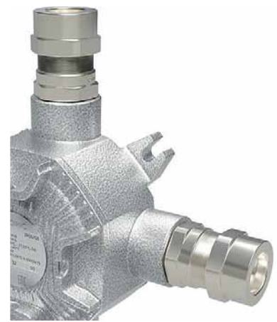
Рис. 2. Кабельный ввод и монтажный кронштейн распределительной коробки серии LBD-ПС-А

Конструкция распределительных коробок выдерживает четырехкратное значение эталонного давления по ГОСТ ИЕС 60079-1–2013. Взрывонепроницаемые распределительные коробки «ДКС» имеют исполнения с видами взрывозащиты: