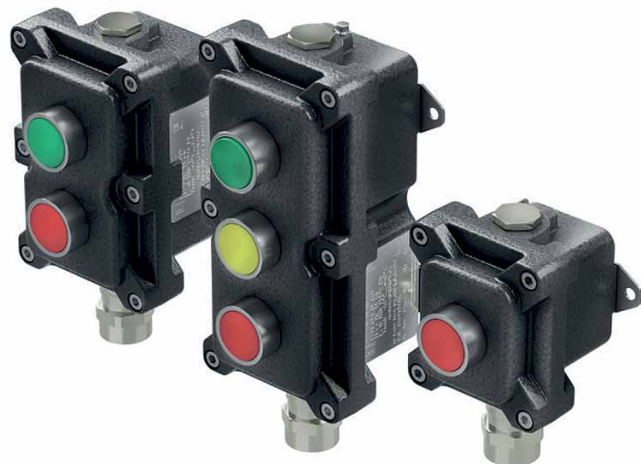
Рис. 3. Взрывонепроницаемые посты управления серии LCSD-ПВ-А

Взрывонепроницаемые посты управления серии LCSD-ПВ-А (рис. 3) предназначены для управления и мониторинга электрических, осветительных цепей постоянного и переменного тока, для защиты соединений цепей