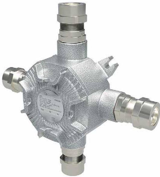
Рис. 1. Взрывонепроницаемая распределительная коробка серии LBD-ПС-А

личные виды взрывозащиты. Взрывонепроницаемое оборудование Armex имеет высокую степень пыле- и влагозащиты – IP66/IP68, что обеспечивает герметичность электрооборудования.