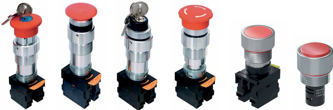
Рис. 4. Элементы управления для взрывонепроницаемых оболочек серии EXDCU

от механических повреждений, пыли и влаги.