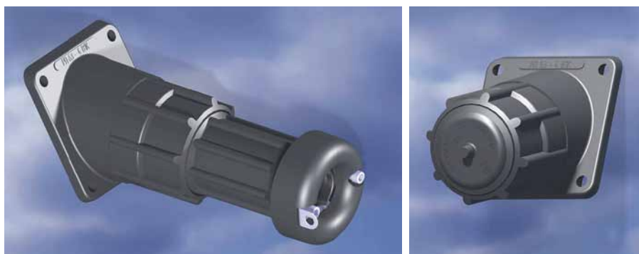
Рис. 2. Разъемы серий РК-ВК и РП-ВП

ответствующие площади, мощности и персонал. Хотя надо признать: наряду с плюсами есть и свои минусы в том, чтобы отдавать эту операцию на сторону. Всегда остается риск того, что люди будут недостаточно аккуратно обращаться с формами, а это очень дорогостоящие в изготовлении детали.