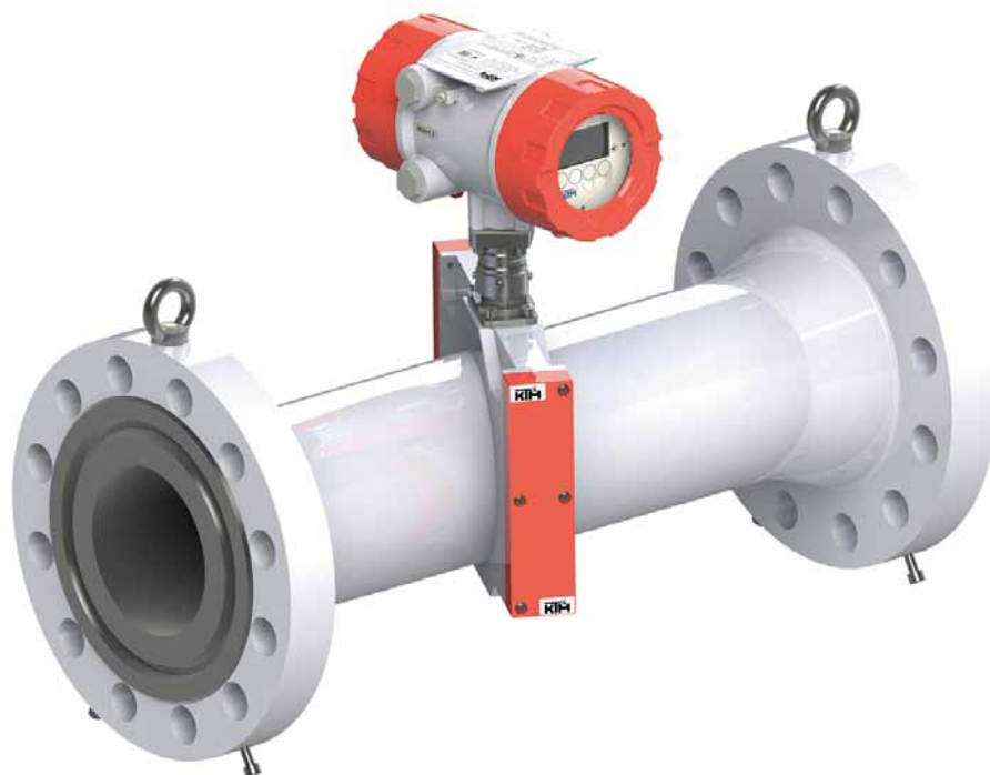
Рис. 2. Ультразвуковой счетчик-расходомер технологического учета природного и попутного нефтяного газа КТМ600 РУС

Еще один ультразвуковой счетчик-расходомер, КТМ600 РУС® (рис. 2), разработан проектировщиками компании и применяется для технологического учета природного газа в сложных условиях эксплуатации, в том числе