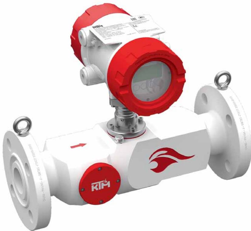
Рис. 3. Ультразвуковой счетчик-расходомер УЗС-1М

Крайнего Севера при температуре до -70\text{ }^{\circ}\text{C} 1 . Для процессов с высоким рабочим давлением (до 50 МПа) в целях надежной и безопасной эксплуатации производитель рекомендует использовать УЗС-1М с цельноточеной версией корпуса. На данный момент на самарском производстве изготавливаются приборы с условным диаметром от 8 до 3000 мм.