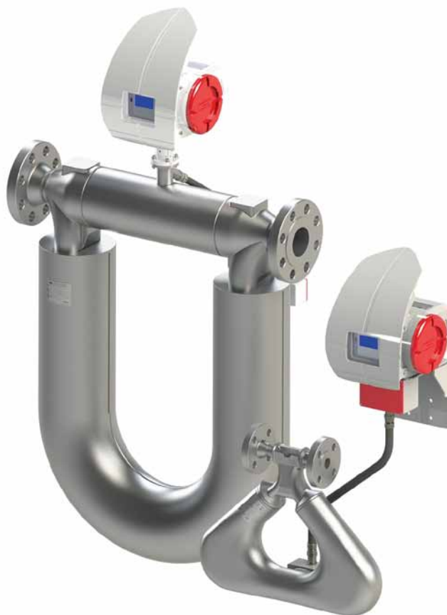
Рис. 4. Кориолисовый расходомер КТМ РуМАСС

Стоит отметить, что при одинаковом условном диаметре линии кориолисовые расходомеры РуМАСС обладают значительно бóльшим максимальным расходом, чем большинст-