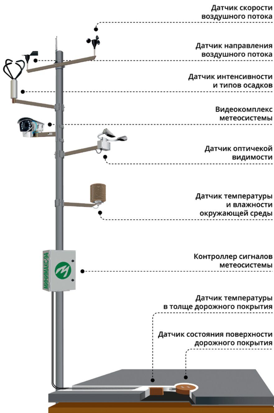
Рис. 2. Автоматическая дорожная метеорологическая станция

источников и вырабатывает специализированный прогноз для каждого участка дороги.