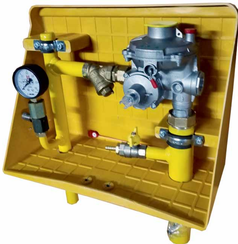
Рис. 4. Домовый газорегуляторный пункт ДРП на базе двухступенчатого регулятора давления газа РД

Другой достаточно крупный проект, реализуемый при непосредственном