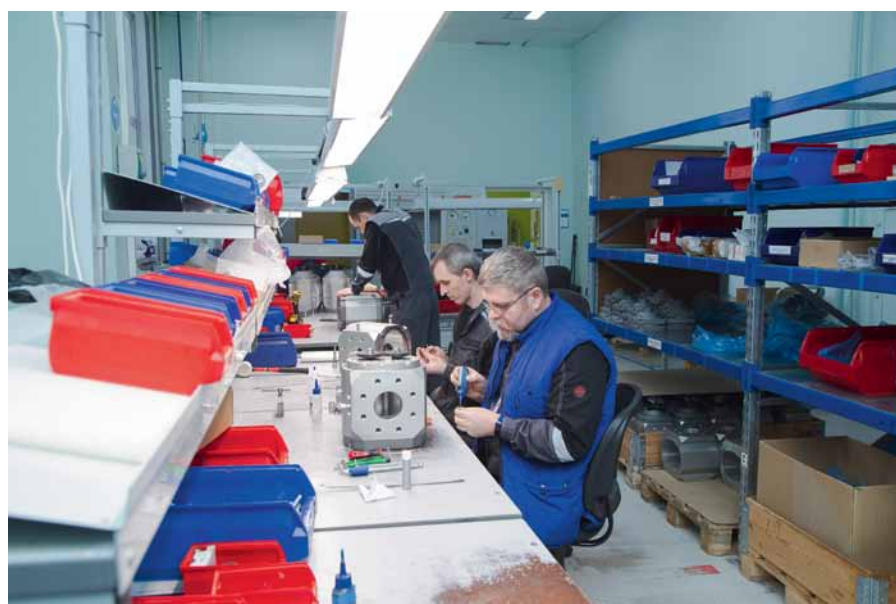
Рис. 2. ООО «РАСКО Газэлектроника» возобновило производство счетчиков газа бытового и промышленного назначения