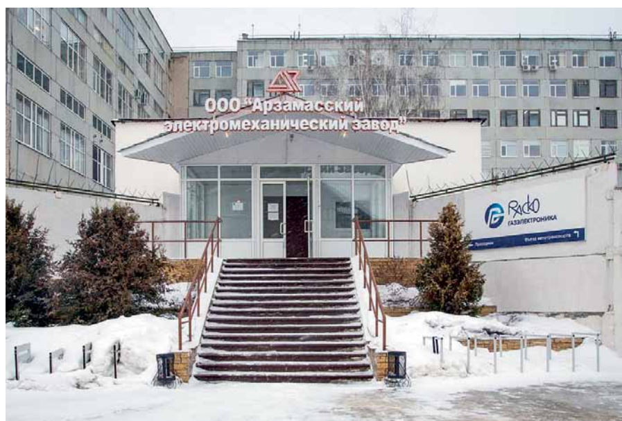
Рис. 1. Производственные помещения ООО «РАСКО Газэлектроника» на территории ООО «Арзамасский электромеханический завод»

В начале 2022 года на предприятии «ЭЛЬСТЕР Газэлектроника» работала команда высококвалифицированных профессионалов – более 250 сотрудников, объединенных общими интересами дальнейшего развития. Метрологическая база насчитывала более 100 единиц эталонного, калибровочного и испытательного оборудования, что позволяло проводить испытания и высокоточные автоматизированные измерения расхода и объемов газа в диапазоне от нескольких литров до 6500 м 3 /ч, избыточного и абсолютного давления, температуры и электричес-