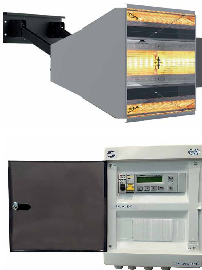
Рис. 5. «Светлый» газовый инфракрасный излучатель ГИИ-С и шкаф управления системой газового отопления ШУ-РАСКО

ООО «НПФ «РАСКО», г. Москва, тел.: +7 (495) 970-1683, +7 (499) 959-1683, e-mail: info@pasko.ru сайт: www.pasko.ru