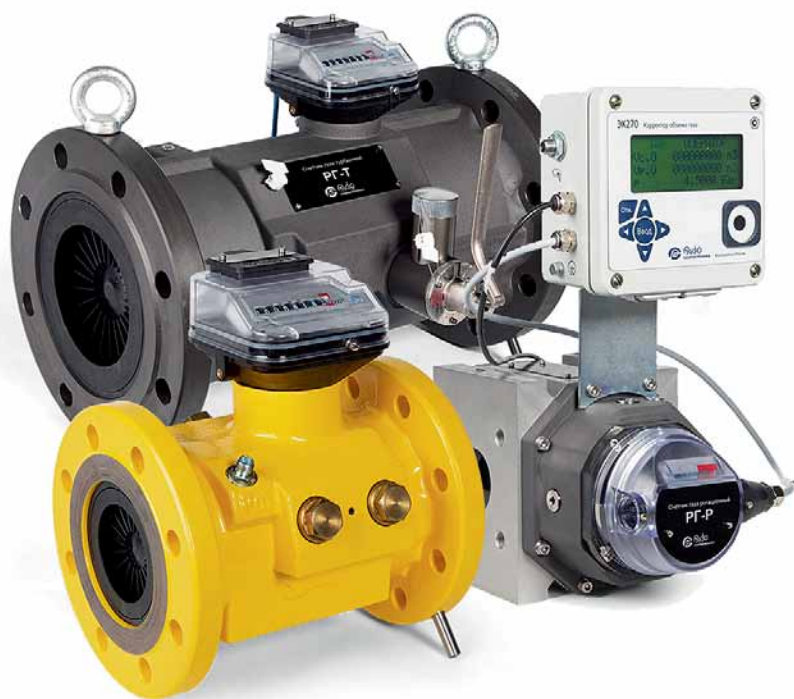
Рис. 3. Обновленная производственная линейка ООО «РАСКО Газэлектроника»: турбинные счетчики газа РГ-Т и измерительный комплекс СГ-ЭК на базе ротационного счетчика РГ-Р

ника» (рис. 2). С момента основания предприятие уделяло повышенное внимание развитию и профессиональному совершенствованию сотрудников. Этому способствовало не только их постоянное обучение на различных курсах повышения квалификации, непосредственное участие в крупнейших семинарах, совещаниях, форумах, но и организация собственных совещаний и семинаров для дилеров, потребителей, сервисных центров. В том числе с участием ведущих специалистов газовой отрасли и крупнейших метрологических институтов.