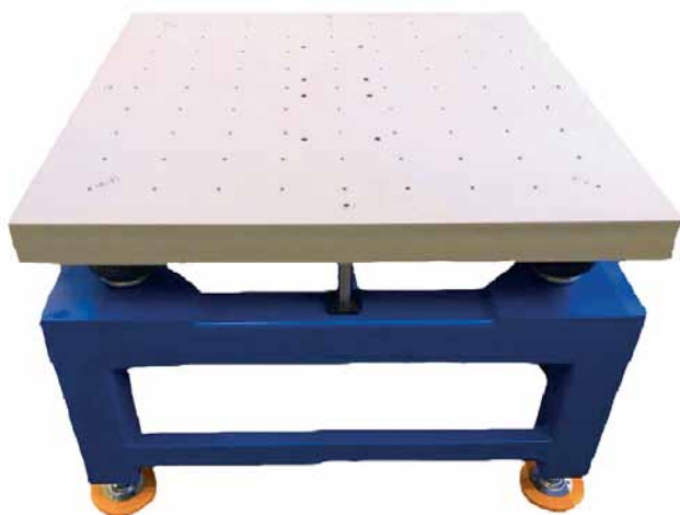
Рис. 4. Стол вибростенда

Первичная аттестация вибростенда по ГОСТ РВ 008-0002-2013, позволяющая подтвердить все заявленные характеристики, была проведена на месте его эксплуатации. Результаты аттестации показали полное соответствие нового оборудования требованиям заказчика и военной приемки. Таким образом, НПП «Универсал Прибор» не только удачно реализовало проект, но и разработало новинку для рынка испытательного оборудования. Теперь новый электромеханический вибростенд представлен в ассортименте компании.