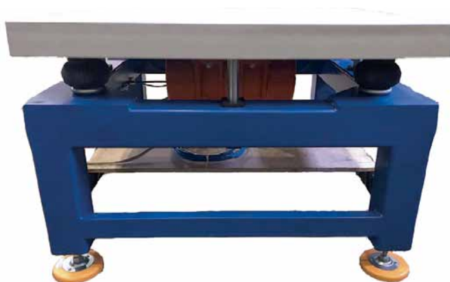
Рис. 3. Электромеханический вибростенд: крепление вибромоторов напрямую к столу

Настройка и мониторинг работы осуществляются с помощью сенсорной панели оператора. Установлен-