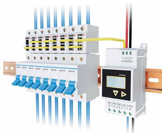
Рис. 1. Многоканальная система измерения параметров электроэнергии и электрический счетчик постоянного тока DFPM20D (SPM20D)

ИСУП: Но ваша новая многоканальная система DFPM20D (SPM20D) (рис. 1) для сетей не переменного, а постоянного тока, верно?