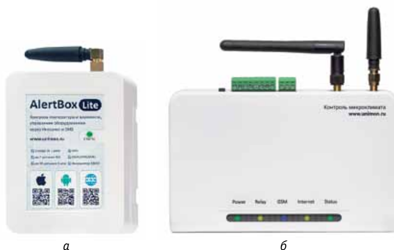
Рис. 4. Контроллеры Unimon: а – AlertBox Lite; б – AlertBox Radio

В базовый комплект с контроллером AlertBox Lite входят блок питания, аккумулятор, GSM-антенна и датчик температуры. Розничная цена комплекта в момент подготовки статьи составляла 6900 руб., и это