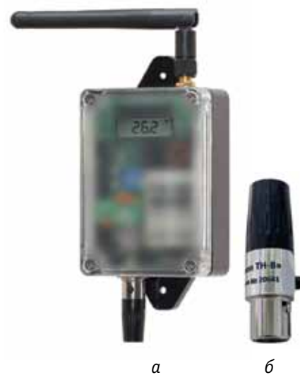
Рис. 3. Датчик AlertNode Advanced: а – передатчик с подключенным сенсором; б – сенсор температуры и влажности Unimon TH-W

Профессиональная и более дорогая модель AlertNode Advanced (рис. 3) – это LoRaWAN-радиомодуль с защищенным корпусом и внешней антенной. Применяется в условиях повышенных загрязнений. Ресурса