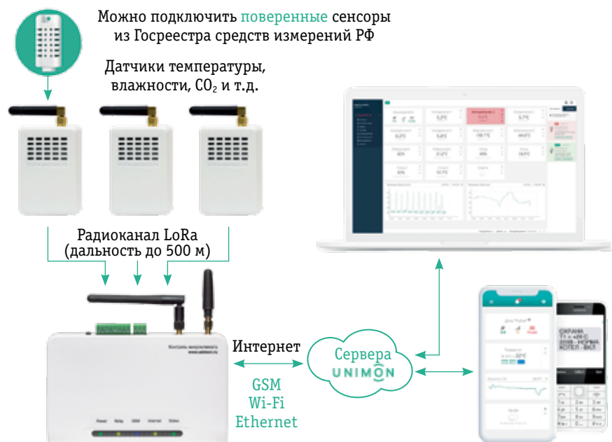
Рис. 1. Схема системы Unimon

▶ различные датчики (температуры, влажности, CO 2 и др.) — главным образом беспроводные, поддерживающие протокол LoRaWAN, с дальностью действия до 500 м, а при идеальных условиях — до километра (отметим, что LoRaWAN из всех «неспециализированных» открытых беспроводных протоколов обеспечи-