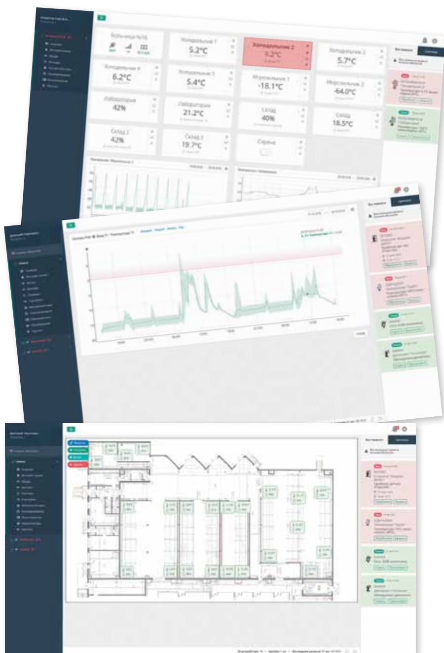
Рис. 5. Программное обеспечение Unimon: примеры интерфейсов