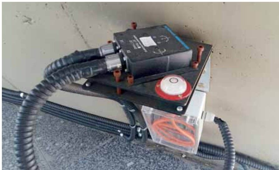
Рис. 1. Инклинометр, установленный на объекте

► в общем случае данные с оконечных устройств передаются по интерфейсу RS-485 (Modbus RTU) на компьютер, а оттуда – на сервер верхнего уровня. С сервера, пройдя всю необходимую обработку, информация поступает на рабочее место диспетчера. Поскольку Modbus – открытый