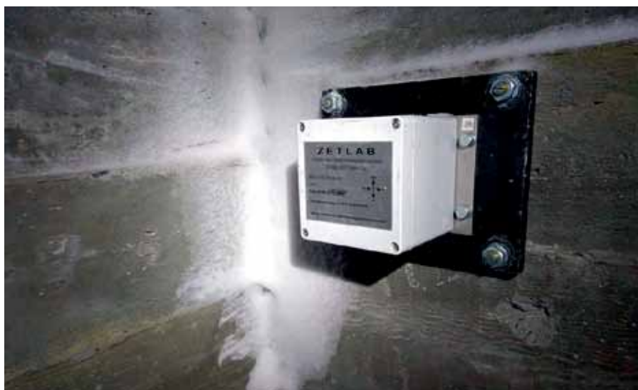
Рис. 2. Цифровой инклинометр с беспроводным каналом связи по протоколу LoRaWAN

Важно, что использование УСПД требуется не всегда. Одна из модификаций датчиков угла наклона – инклинометр ZET 7054 (рис. 2) – обладает встроенным электронным блоком, назначение которого – преобразовывать собственный сигнал датчика в формат LoRaWAN. Инклинометр ZET 7054 отправляет данные сразу на базовую станцию, без посредства УСПД. Конечно, базовую станцию все равно придется установить, но это не очень