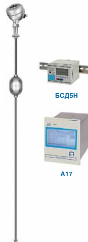
Рис. 1. Внешний вид и структурная схема многофункционального поплавкового уровнемера ДУУ11