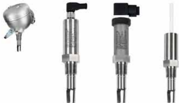
СУР-16-TUN корп. «С»