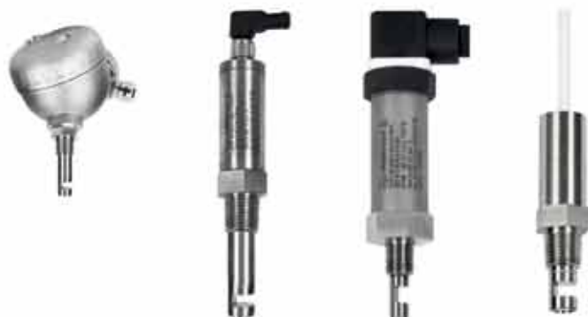
СУР-16-GAP корп. «С»