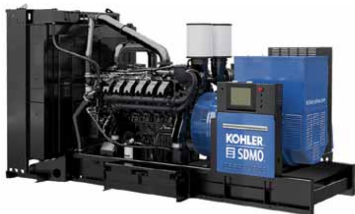
Рис. 3. Электростанция KD Series на базе двигателей KOHLER

«ГрандМоторс» носит звание мастера-сервис-дистрибьютора KOHLER-SDMO. Это эксклюзивный статус, которым наделяется самый сильный партнер KOHLER-SDMO в вопросах сервиса, технической и гарантийной поддержки конечных клиентов в стране. Только в компетенцию мастер-сервис-дистрибьютора наряду с проведением регулярных работ входят диагностика, регулировочные работы, ремонт агрегатов и компонентов, а также капитальный ремонт двигателя, в том числе в рамках гарантийной поддержки всех электростанций KOHLER-