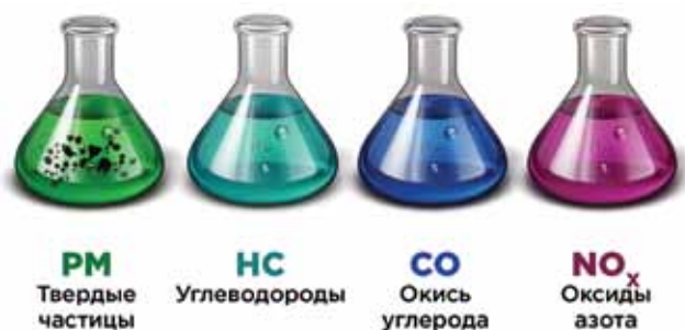
Рис. 2. Компоненты, содержащиеся в выбросах дизельных электростанций

твердые частицы, нагар и копоть от сгоревшего масла и топлива. В целом все они являются побочным эффектом от сгорания топлива и имеют похожую природу и состав, но для этой статьи важно назвать каждый из них в отдельности (рис. 2).