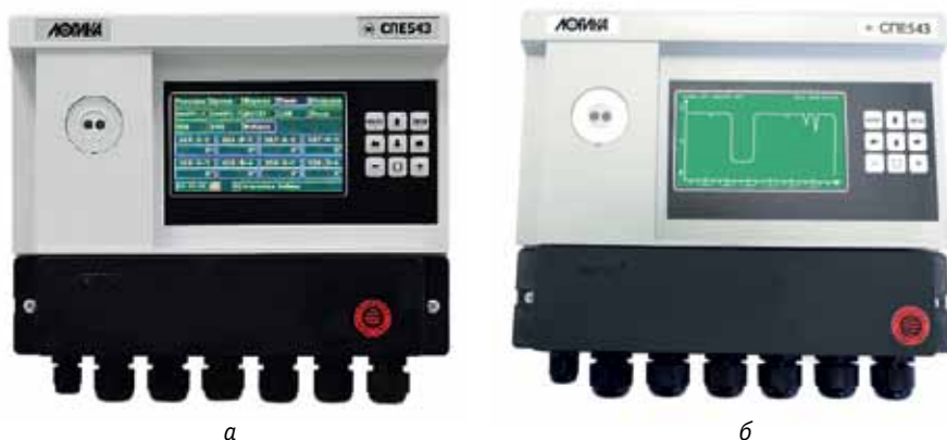
Рис. 1. Сумматор СПЕ543: а – общий вид, б – отображение архивов в виде графиков

Сумматор СПЕ543 может эксплуатироваться как в «одиночном» режиме, так и в составе распределенной измерительной системы, подразумевающей объединение в локальную сеть до восьми сумматоров, один из которых объявляется ведущим. Ведущий позволяет систематизировать данные, формируемые остальными сумматорами, накапливать и передавать их по цифровым каналам связи. Связь сумматоров в пределах такой