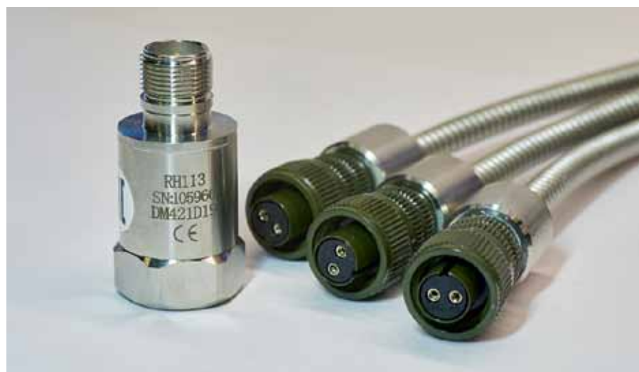
Рис. 5. Бронированный кабель RHСAB-XX и датчик Ronds RH113

Стандартный вариант поставки кабеля – с прямым разъемом, схема соединения – двухпроводная с экраном, опционально возможно производство кабелей с угловым разъемом 90°. На склад компания изготавливает кабели с наиболее ходовой длиной 5 м, в то же время по желанию заказчика ее можно изменить. По сравнению с аналогами основными отличительными особенностями кабелей производства «НПП АСУ ТЭК» являются цена, качество и сроки изготовления и поставки продукции. Так, срок изготовления 100 единиц стандартных кабелей не превышает 10 рабочих дней с даты заказа, со склада продукция отгружается в течение 3 рабочих дней. До конца 2022 года действует маркетинговая программа, в соответствии с которой кабели продаются фактически по себестоимости.