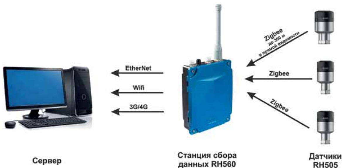
Рис. 3. Архитектура системы CMS

На российском рынке «НПП АСУ ТЭК» предлагает датчики-акселерометры Ronds серии RH1xx, а также беспроводную систему измерения вибрации.