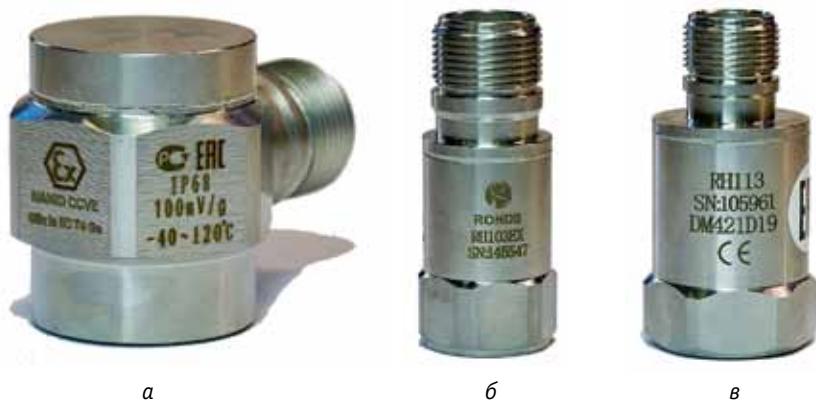
Рис. 4. Датчики виброускорения: а – RH102EX; б – RH103EX; в – RH113

Беспроводная система CMS, разработанная компанией Ronds, предназначена для промышленных предприятий, на которых точки измерения разбросаны и нет возможности (или целесообразности) выполнять электромонтажные работы. Система позволяет измерять сигналы вибрации и температуры.