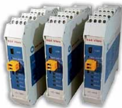
Рис. 1. Устройства виброконтроля серии VC1800

Отдельную линейку уникальной аппаратуры компании Brüel & Kjær для вибромониторинга и оценки виб-