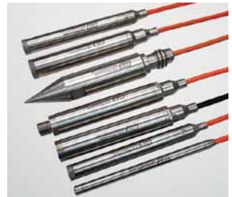
Рис. 3. Струнные пьезометры серии 15xx