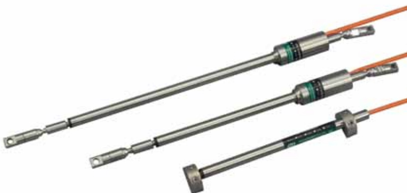
Рис. 2. Датчики раскрытия трещин и стыков с колеблющейся струной от компании ACE Instrument

Еще один вид оборудования ACE Instrument со струной в качестве чувствительного элемента — это струнные пьезометры серии 15xx (рис. 3), которые устанавливаются в скважину и служат для измерения порогового давления воды (уровень грунтовых вод при геотехническом мониторинге). Такой вид измерений востребован на гидротехнических сооружениях, дамбах и насыпях, косогорах и т.д. Все датчики имеют кабель, по которому передаются электрические сигналы, длина кабеля может достигать 1,2 км без ущерба для качества сигнала. Также все датчики оснащены встроенным термистором, который учитывает тепловое расширение чувствительного