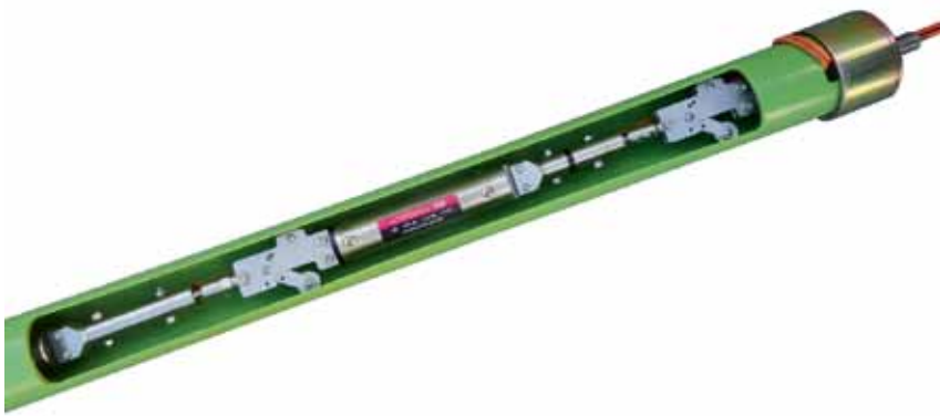
Рис. 4. Многоточечный скважинный инклинометр

элемента – металлической струны – и вносит поправку в показания прибора. Так что приборы серии 15xx оптимально подойдут для ситуаций, когда требуются надежные, точные и долговременные измерения.