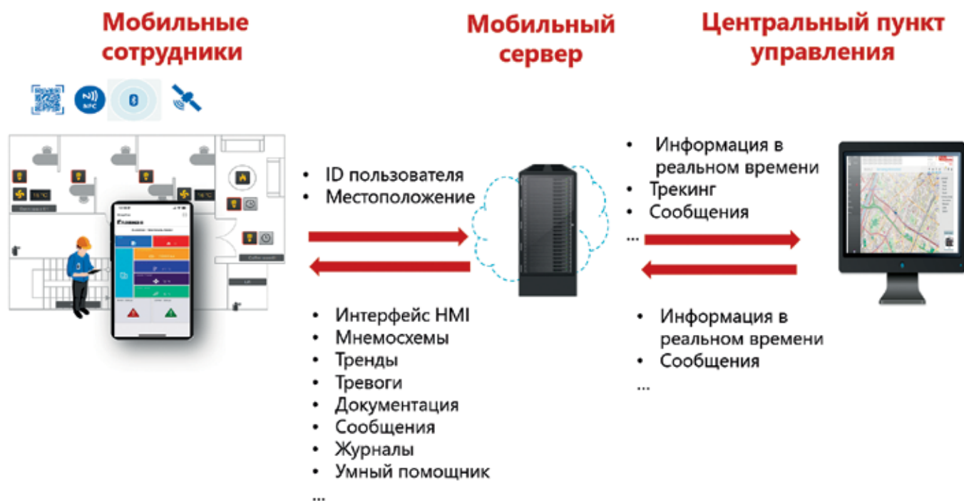
Рис. 2. Принцип работы мобильного приложения SnapVue

При этом сегодня некоторые заказчики стали планировать веб-доступ не как дополнение к SCADA, а как самостоятельное решение – единый портал, развернутый в облачном хранилище. Пользователями портала являются самые разные сотрудники: от инженеров и диспетчеров до руководителей подразделений и предприятия. Такую архитектуру легко реализовать в облаке с применением продуктов PcVue Solutions, предоставив все возможности мониторинга и управления