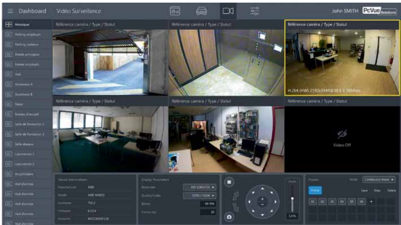
Рис. 4. Управление камерами в PcVue

заний счетчиков в Университетской больнице в Гренобле. Заказчику требовалось получить возможность быстро измерять и контролировать оборудование, но при этом сделать это недорого, без прокладки кабеля (Ethernet) и установки источников питания. С помощью оборудования Adenius и технологии LoRaWAN удалось охватить системой мониторинга все здания большого комплекса в радиусе около 6 км.