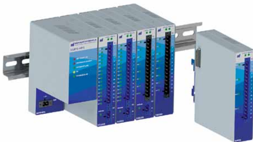
Рис. 1. Устройство распределенной периферии БМРЗ-УРП

Структура системы на базе БМРЗ-УРП АСУ ТП и распределенная периферия на базе БМРЗ-УРП имеют трех-