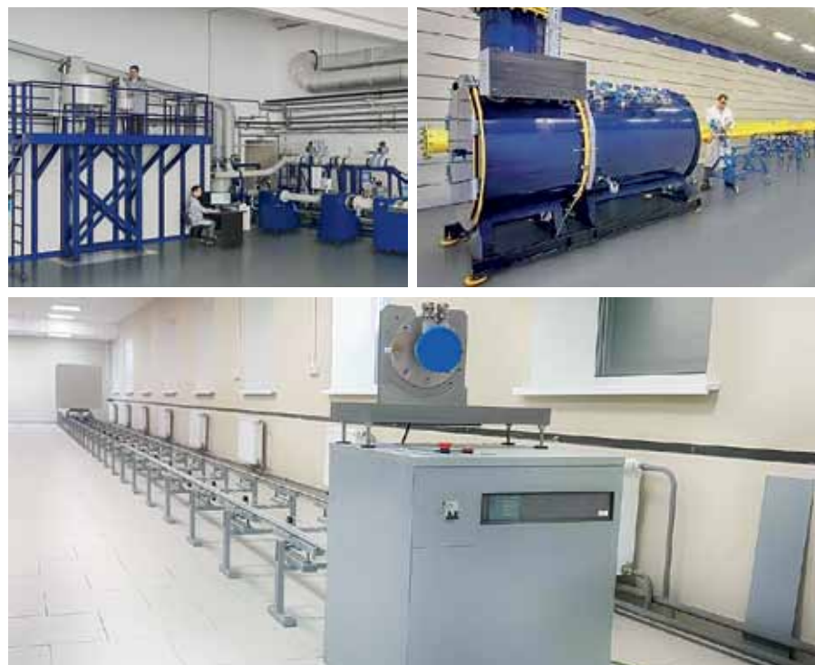
Рис. 3. Поверка расходомеров и уровнемеров

Имея мощную производственную базу, метрологическую лабораторию и высококлассных специалистов-метрологов, НПП «ЭЛЕМЕР» остается открытым для своих партнеров, предоставляя заказчикам все возможности, связанные с самостоятельным выполнением ими ремонта продукции производства НПП «ЭЛЕМЕР». Для этого организовано бесплатное обучение технических специалистов заин-