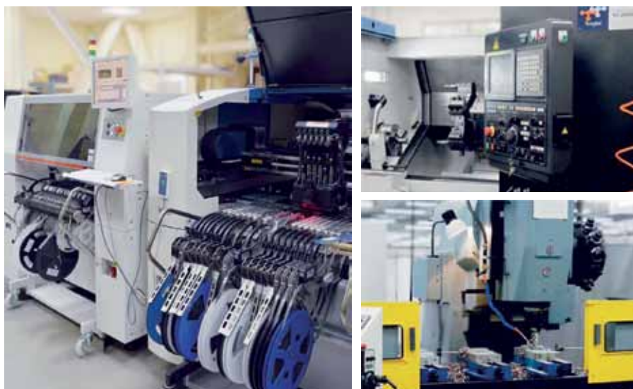
Рис. 2. Автоматизированная линия по установке и пайке компонентов и высокотехнологичные обрабатывающие центры

плексы, эталонные преобразователи давления и т. д.), а также арматуру для датчиков давления и температуры.