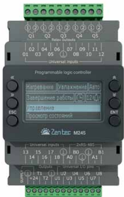
Рис. 3. ПЛК Zentec M245