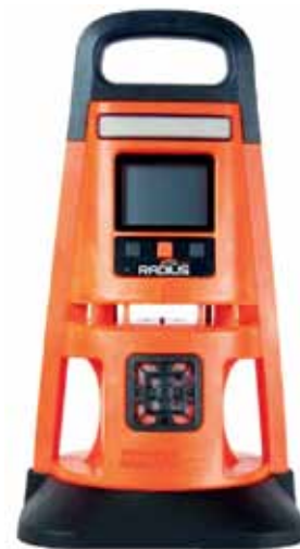
Рис. 4. Газоанализатор Radius BZ1

Radius BZ1 (рис. 4) — это прочный зональный газоанализатор, который способен охватить все рабочее место. Газоанализатор может быть развернут за секунды для сценариев аварийного реагирования, оставлен в полевых условиях на срок до 7 дней без подзарядки или на неограниченный период с использованием солнечного источника энергии. Radius передает показания и сигналы тревоги другим устройствам и персональным газоанализаторам с помощью LENS, что позволяет создавать динамическую сеть безопас-