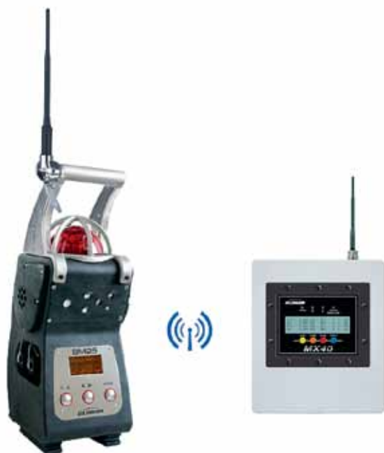
Рис. 2. Зональный газоанализатор VM25 и контроллер MX40

вия — 3 км в условиях прямой видимости (рис. 1). Тип выбранной сети зависит от количества детекторов газа, зоны покрытия и архитектуры сети. OLCT 80 W идеально подходит для передачи данных в широком спектре промышленных систем обнаружения и сигнализации. Приемопередатчик работает на общепринятой разрешенной в России частоте 2,4 ГГц, которая находится в радиодиапазоне ISM (промышленный, научный и медицинский), и может передавать данные об уровне загазованности и состоянии газоанализатора. Беспроводная версия OLCT 80 исключает затраты на проводку и очень легко вводится в эксплуатацию в полевых условиях. Устройство можно интегрировать в систему с контроллером MX 43 с использованием стороннего приемопередатчика 2,4 ГГц от компании Vanper Engineering.