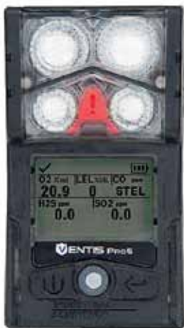
Рис. 3. Анализатор газов Ventis Pro5

зоне. Теперь, когда происходит утечка газа и прибор переходит в режим тревоги, все участники подключенной группы мгновенно получают об этом оповещение. Данная технология может спасти не одну жизнь за счет раннего информирования персонала.